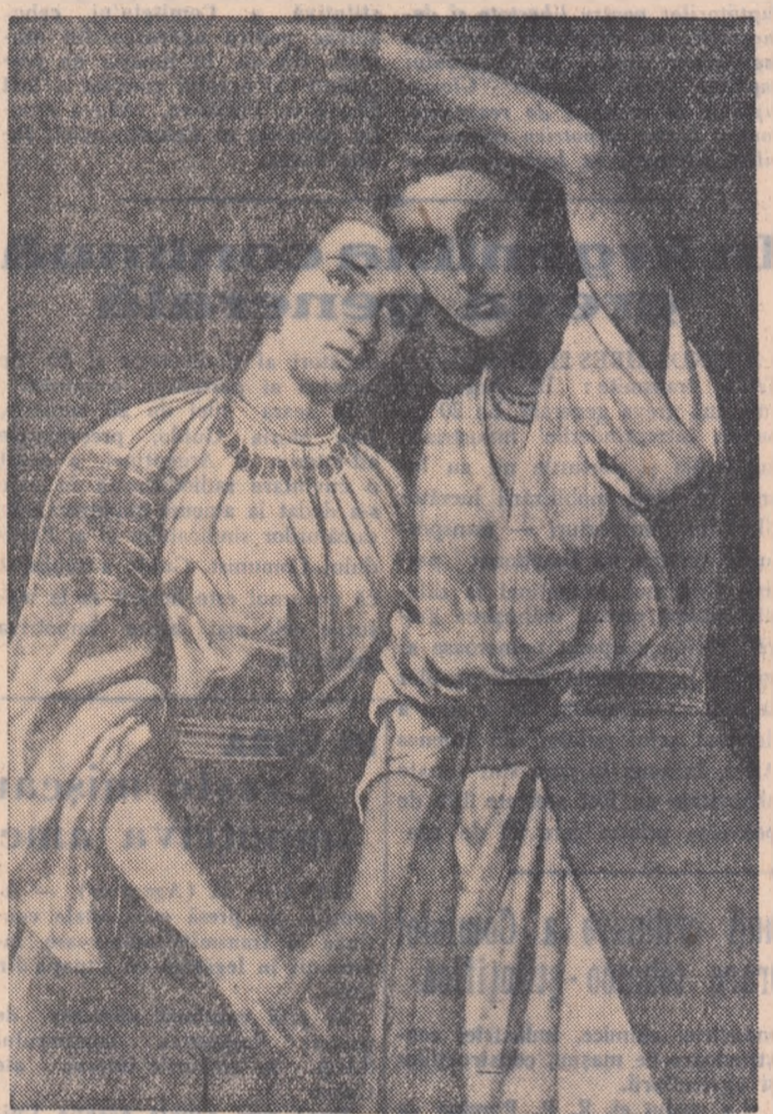
Tabloul reproduc mai sus reprezentînd Unirea Țărilor Romîne, e opera lui Theodor Aman. El se află expus în Muzeul Unirii din Iași.