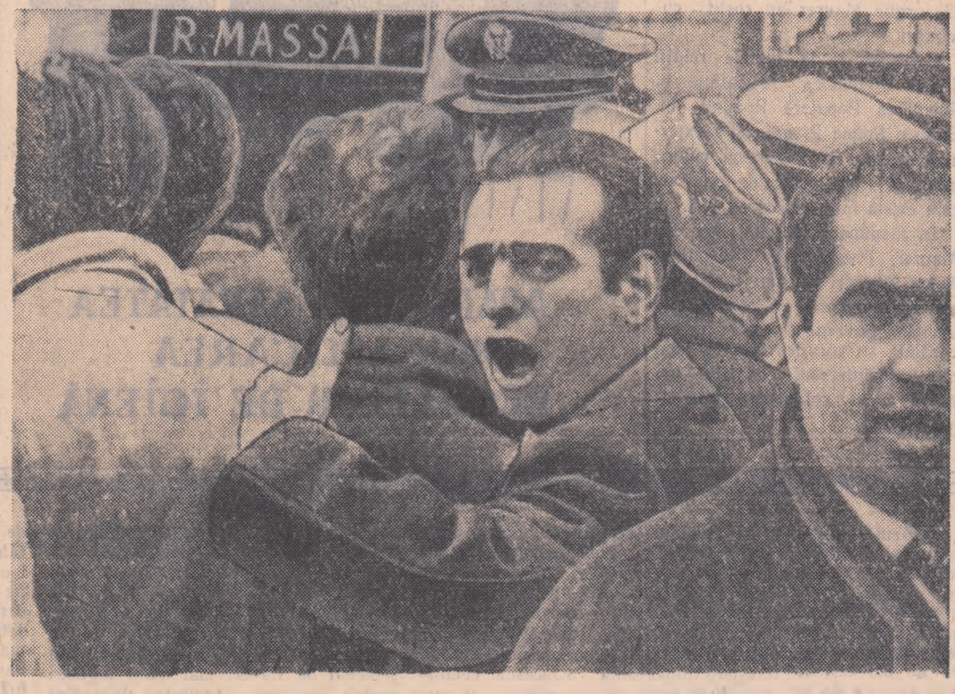
Peste o sută de șomeri din orașul Neapole (Italia) au organizat o demonstrație în fața primăriei orașului, cerind de lucru, dreptul la existență. Ei au fost înși atacați de poliști care i-au somat să se împrăștie. Intre poliști și șomeri s-a produs o ciocnire în cursul căreia au fost răniți mai mulți muncitori șomeri. In fotografie: în timpul demonstrației din fața primăriei din Neapole

IN CUBA Crește mișcarea de protest împotriva amestecului S. U. A. Aceeași agenție anunță că consiliul Universității din Havana a hotărât să înlăture din Universitate pe acei care au colaborat cu regimul dictatorului Batista.