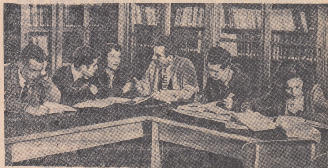
În biblioteca facultății de științe naturale a Universității „Al. I. Cuza” din Iași, studenții se pregătesc intens pentru examene