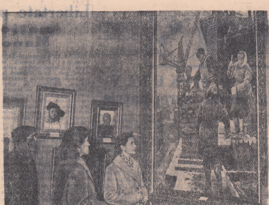
Tinerii bucureșteni vizitează cu interes Expoziția de Artă Plastică a U.R.S.S. deschisă în sala „Dalles”

— Raportul asupra executării bugetului Consiliului Central al Sindicatelor pe anul 1958 și pro-