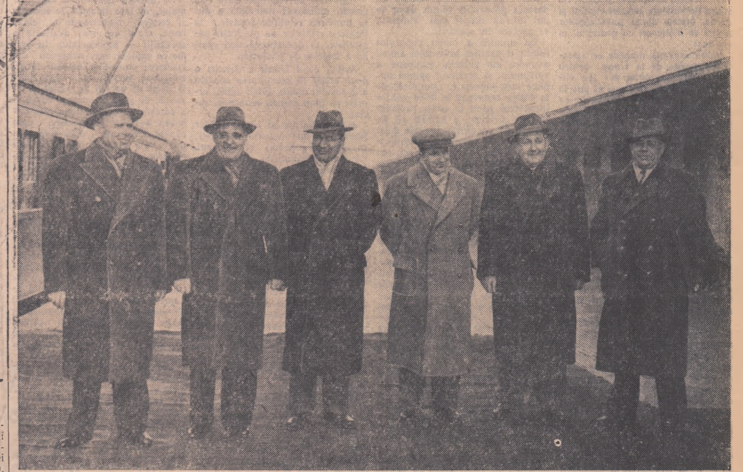
Pe peronul gării Băneasa înainte de plecare.