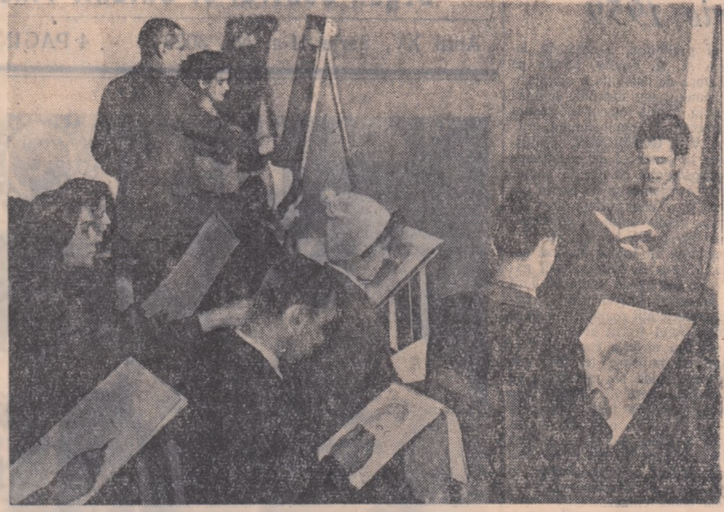
Pe lângă Școala populară de arte din Craiova funcționează o secție de artă plastică. Aici vin cu drag tinerii muncitori de la „Electropreț”, „7 Noiembrie”, „I. C. Frimu”, elevi din școli etc. La cursuri ei primesc îndrumări tehnice de specialitate, își îmbogățesc cunoștințele de cultură generală. Aparatul fotografic a surprins pe elevi în cursul unei lecții.

IOAN TODEA secretar al Comitetului rațional U.T.M. Tg. Mureș