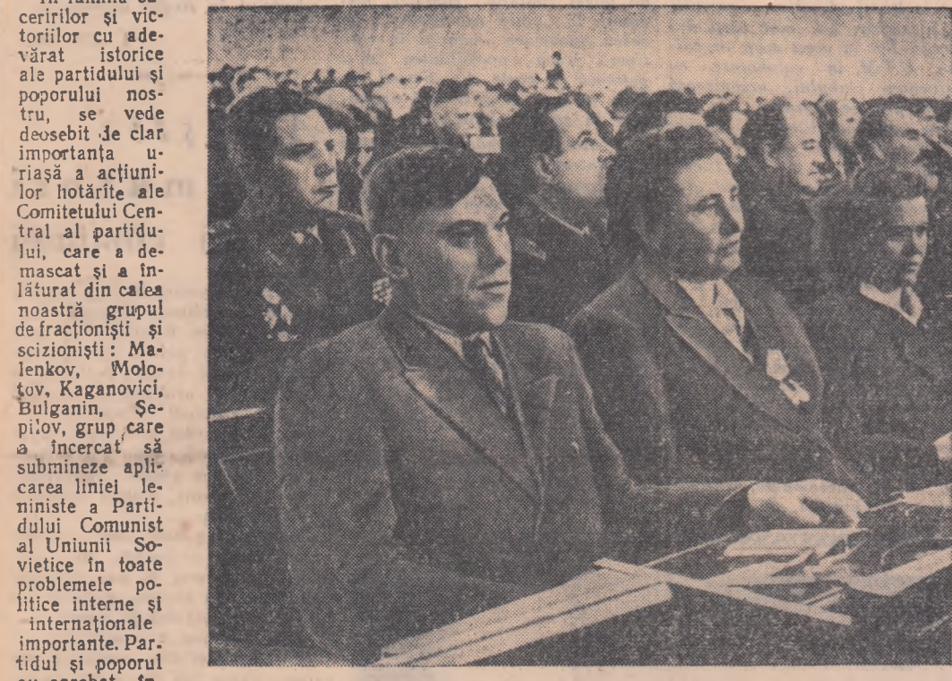
Un aspect din sala Congresului