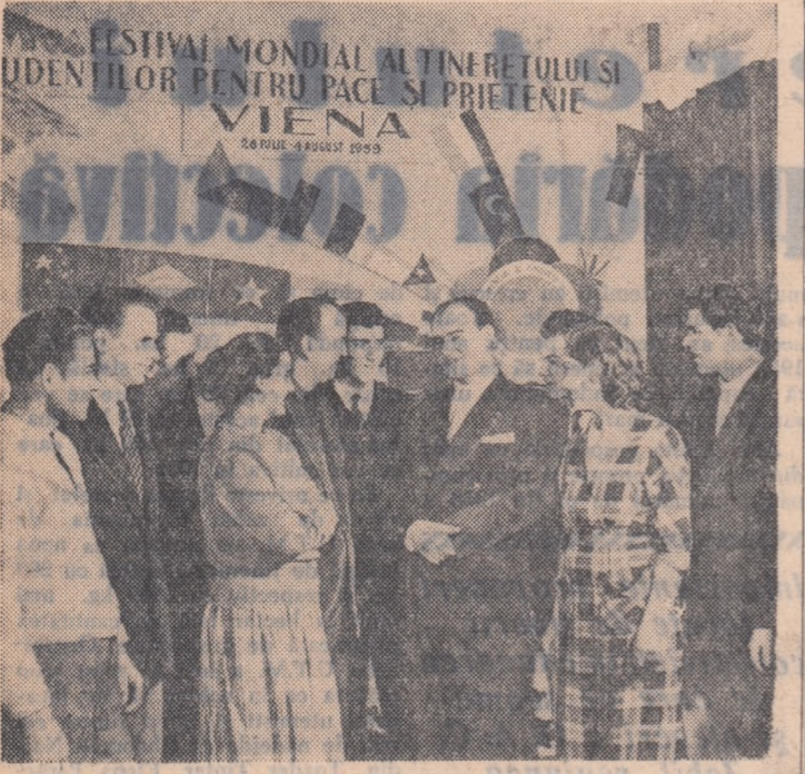
In fotografie: Un aspect de la „Colțul Festivalului”.

Colțul Festivalului de la uzina „Mao Tse-tun” a fost deschis în sala primitoare a noului club inaugurat cu această ocazie. Zece de stegulețe, reprezentînd țările lumii, se odărnă într-un singur punct: Viena, locul unde tineretul lumii se va întrîni să sărbătorească cel de-al VII-lea Festival Mondial al Tineretului și Studenților.