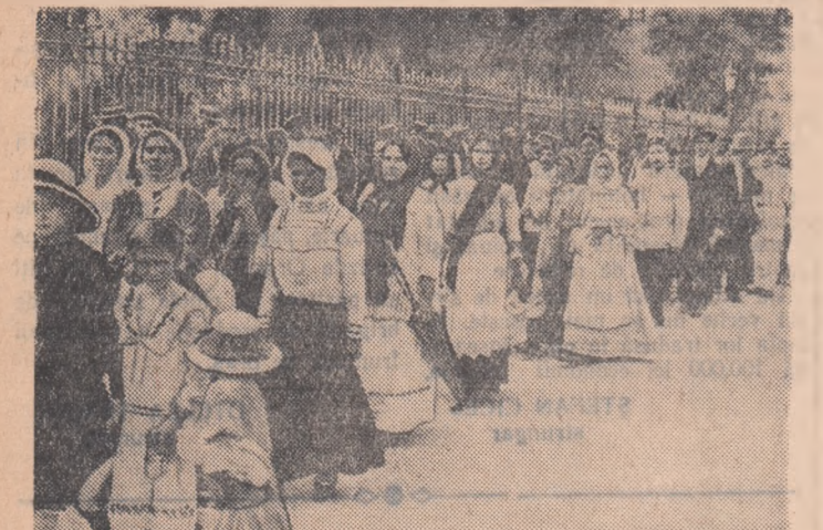
Muncitoare de la S.T.B., împreună cu familiile lor, demonstrînd în 1914 pe străzile Bucureștiului