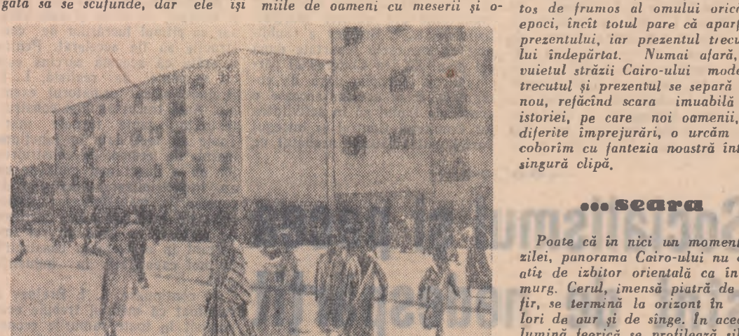
Blocuri de locuit construite de stat în Cairo

Ușa se deschise încet, iar în cadrul ei apăru o doamnă din „finalta societate” americană. Drept răspuns la salut, negustorul din spatele teștelei i se adresa cu o voce micășoară: — Cîți copii doriți? — Deocamdată numai unul. — Cum să fie, mai vrei sau me-lanciole? — Mai întîi să-l văd... — Nu vă separați, știți, să nu ne deranjăm degeaba... Sintem casă de încredere. Prețul, după cum este și copilul, variază între 2000 și 3000 de dolari.