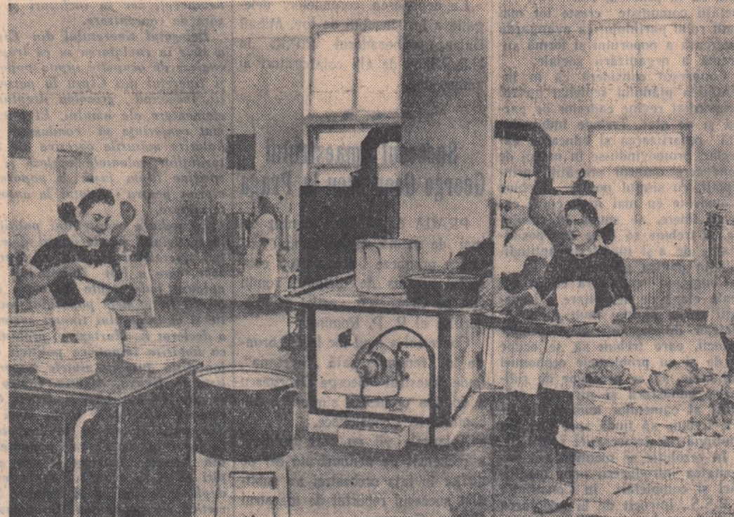
La uzina de superstoreții de la Năvodari a fost dată în folosință o cantină de mare capacitate înzestrată cu o bucatărie modernă, cu instalații automate pentru diferite preparate, spălătoare electrice și frigider de mare capacitate pentru carne și zarzavaturi etc. In fotografie: aspect parțial al bucatăriei.

Consiliul Național al Femeilor din R.P.R. și Uniunea Scriitorilor anunță că, în urma cererilor primite, termenul de predare a lucrărilor pentru concursul de creație literară „Figuri de femei din patria noastră în lupta pentru construirea socialismului” se prelungește pînă la 5 iunie. In ziua de 6 februarie la Ambasada R.D. Germane a avut loc o conferință de presă. Ambasadorul extraordinar și plenipotențiar al Republicii Democrate Germane, Wilhelm Bick, a făcut o expunere cu privire la problema Tratatului de pace cu Germania. La conferința de presă au participat reprezentanți ai presei romine și străine. (Agerpres)