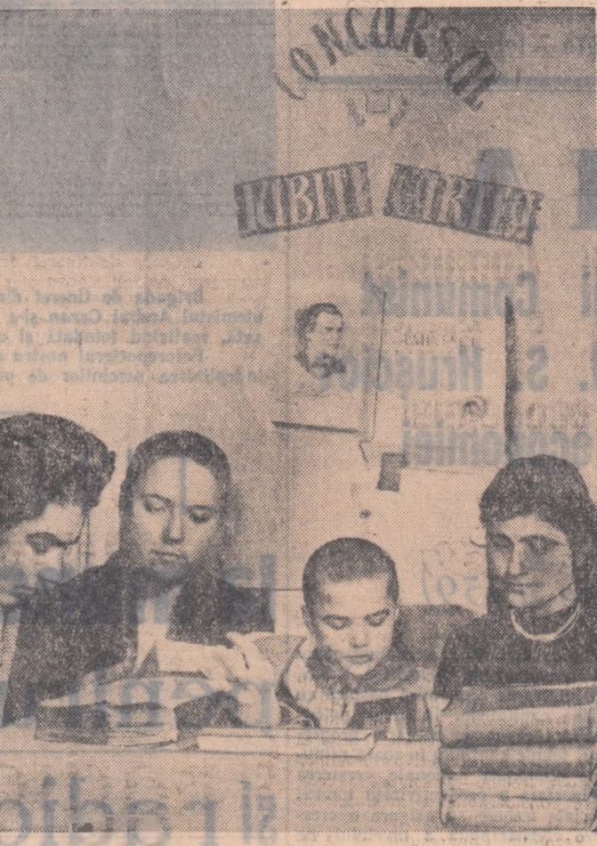
În activitatea politică de masă desfășurată în comuna Cloara-Doicești, raionul Călmățu, un loc deosebit îl ocupă munca cu cartea. Numărul participanților la concursul „Iubiți cartea” este în continuă creștere. În fotografie: un aspect din sala de lectură a căminului cultural.