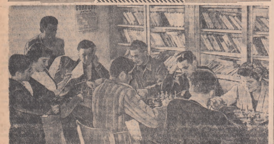
De curînd în comuna Comana, raionul Negru Vodă, colectiviștii din G.A.C. „Fillimon Sirbu” au construit un frumos cămin cultural. Tinerii, care au participat cu multă dragoste la ridicarea acestui lăcaș de cultură, desfășoară acum aici o bogată activitate cultural-educativă. Fotografia noastră vă prezintă un aspect din timpul concursului de șah organizat în sala bibliotecii noului cămin.