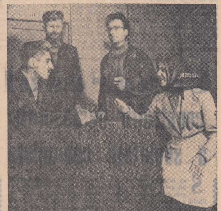
Formațiunea de teatru a cooperativei meșteșugărești Borcea din Călnărași regiunea București este cunoscută și apreciată de cetățenii comunei. Ea prezintă piese interesante la Casa de cultură raională. În prezent formațiunea de teatru pregătește o nouă piesă „Oaspetele din fapțul serii” de Horia Lovinescu. În fotografie: aspect din timpul repetiției.