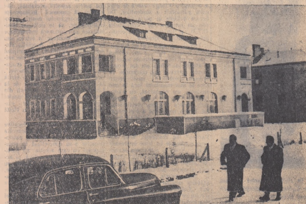
Clubul și cantina fabricii de produse lactate din Remetea