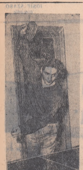
În zilele vacanței la Casa de Cultură a Studenților „Gri-gore Preoteasa”.

— Formația de dansuri populare și orchestra de folclor a Casei de Cultură va prezenta un festival artistic la Casa de Cultură a tineretului din raionul Gh. Gheorghiu-Dej. În zilele conferinței se vor organiza în institute întâlniri între tineri delegați și colegii lor, întîlniri cu studenții străini, seri de cîntece patriotice etc.