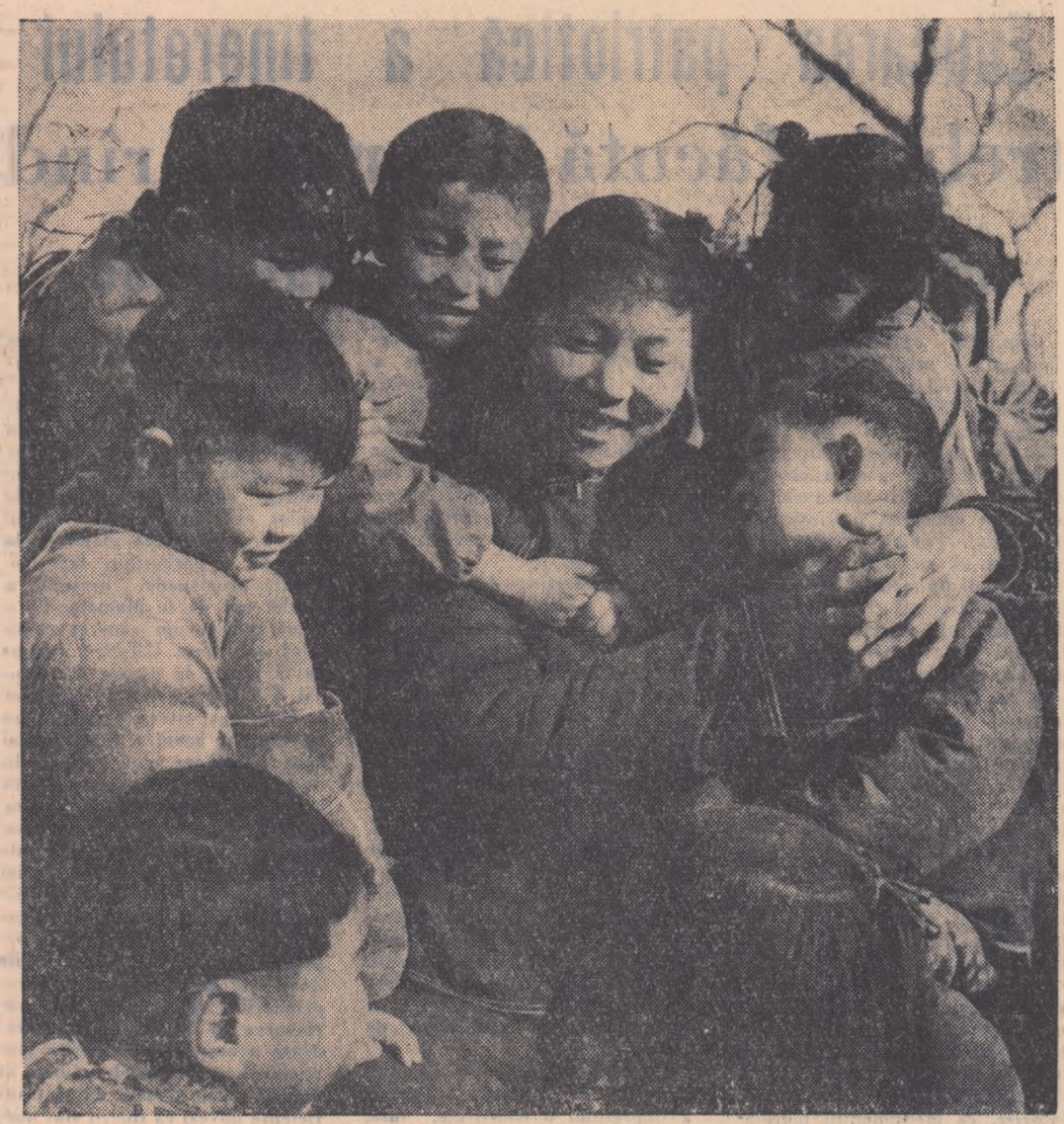
Orinduirea democrat-populară din R.P. Chineză se îngrijește de viața și fericirea copiilor...