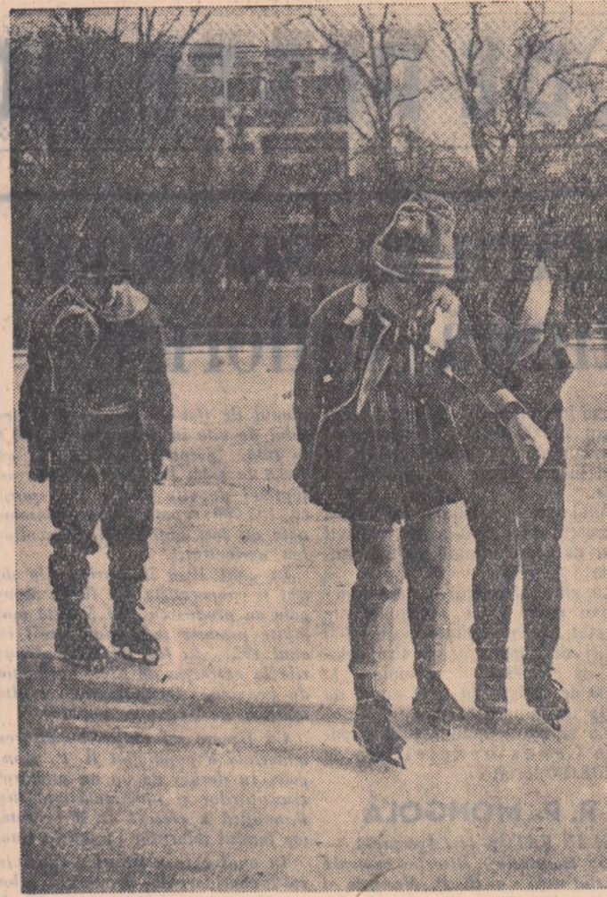
Primi pași pe gheață