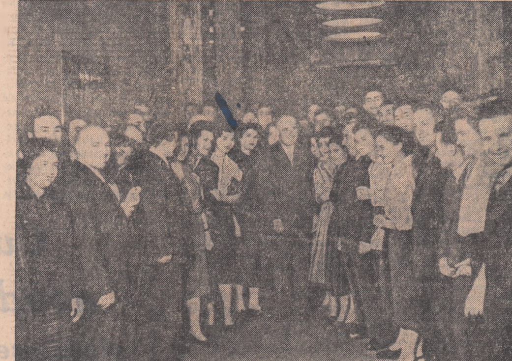
Tovarășii Gh. Gheorghiu-Dej și alți conducători ai partidului și guvernului în mijlocul unui grup de studenți și studențe de la universitățile „V. Babeș” și „Bolyai” din Cluj, delegați la a doua Conferință Națională a U.A.S.R.