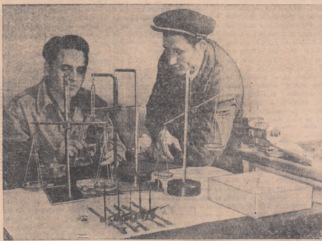
Anul acesta la uzinele „21 Decembrie” din Capitală au fost introduse în fabricație o serie de produse noi. Printre acestea se numără balanța farmaceutică de 100 gr., 20 gr., și 10 gr., șubleră centimetrică veterinară și truse pentru măsurarea aparatelor optice.

Conștienți că obținerea unei producții sporite de oțel contribuie la dezvoltarea continuă a economiei naționale și la întărirea capacității de apărare a patriei noastre, noi vom depune toate eforturile pentru a realiza angajamentele pe care ni le-am luat, de a da patriei noi mai mult oțel.