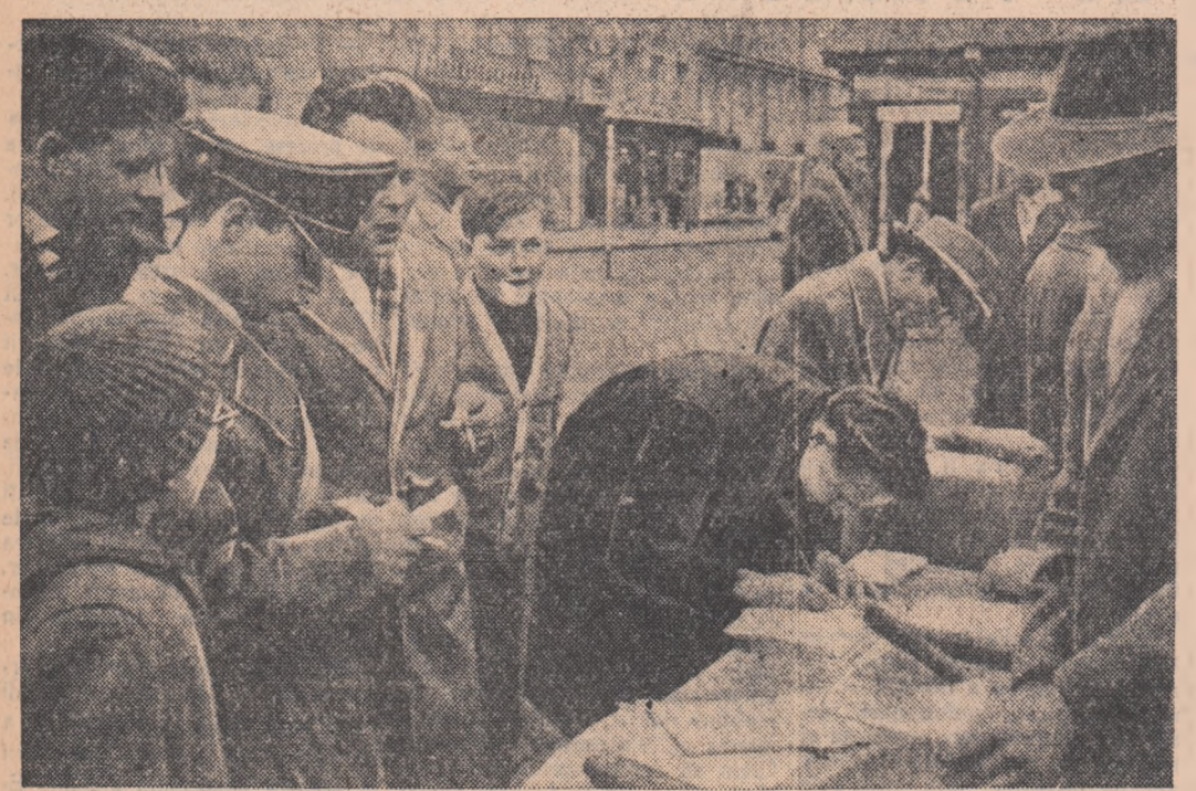
În numai două zile, peste 3.000 de bărbați și femei din Wuppertal din regiunea Ruhr-ului au semnat o petiție adresată Bundestagului, prin care cer interzicerea staționării și depozitării de arme atomice în Germania Occidentală.

DJAKARTA 27 (Agerpres). — Răspunzînd invitației președintelui Republicii Indonezia Sukarno la 27 februarie a sosit la Djakarta Ho Și Min, președintele Republicii Democratice Vietnam. La aerodrom președintele Republicii Democratice Vietnam a fost întâmpinat de președintele Indoneziei, Sukarno și de alte persoane oficiale indoneziene, precum și de membri ai corpului diplomatic. Poporul indonezian a făcut o primire deosebit de călduroasă președintelui Ho Și Min. Sute de mii de locuitori ai Djarkartei au ieșit pe străzi pentru a saluta pe înalțul oaspeț. Străzile Djarkartei au fost împodobite cu drapelul de staț ale celor două țări, cu portretele lui Ho Și Min și Sukarno.