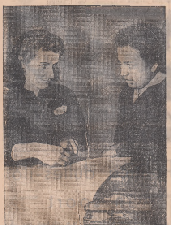
Paralel cu lupta dusă pentru obținerea unei calități superioare muncitorii de la fabrica de încălțăminte „Dobrogeanu Gherea” din Oradea, desfășoară o intensă activitate pentru cit mai mari economii de materii prime și auxiliare.