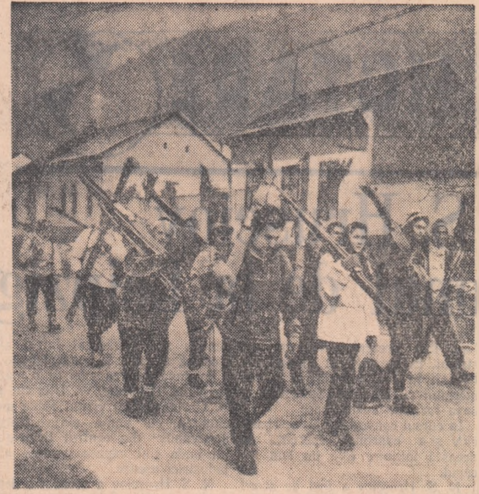
Schișorii din colectivul sportiv „Meteor” - Timișoara în drum spre muntele Semenic.

De aceea ei se pregătesc temeinic la disciplinele sociale. Studenții noștri înțeleg de asemenea tot mai bine rolul social al medicului. Din întîlnirile pe care le-am organizat între absolvenții ce lucrează în mediul rural și studenții din ultimii ani a apărut clar că studenții doresc ca după absolvire să plece în majoritate acolo unde patria are nevoie de contribuția lor.