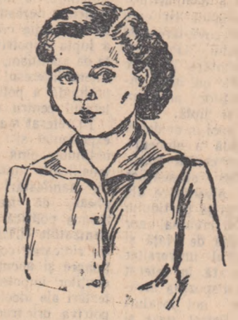
În iarna aceasta cercul pedagogic al raionului „Grivița Roșie” a ascultat referatul ei cu privire la muncă cu părinții. Cei de față, învățătorea cu decenii de activitate la catedră, au privit cu nesașă curiozitate această fată cu trăsături calme și ochi limpezi care la împărțirea o experiență atât de bogată. Cum să facă ea și acei țărani, alfabetizați la jumătatea vieții, să vină la școală cu regulat pentru a se interesa de situația la carte a odraslelor... Să ducă muncă de pedagog într-un fel atât de simplu și de convinsător încît fiecare mamă să priceapă și să-și urmeze cu sfîșnită atenție copilul... Stimularea aptitudinilor copiilor, armonia din familie și rolul ei asupra educației, problema autorității părintești în legătură cu dragostea și îngăduința. Însă, însemnate lucruri teoretice cu răsunere practică, cu urmări foarte mari în viața viitorilor cetățeni? Învățătorea vorbea? Instrucea superioră de pionieri vorbea? Tîrîna care se gîndește la familia ei de mîine vorbea?