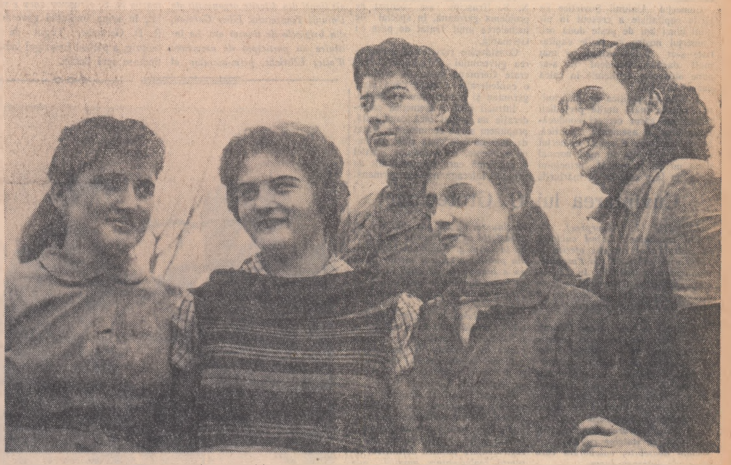
Brigada utemistă „8 Martie” din secția pregătirii bobinaje a uzinelor „Klement Gottwald” din Capitală își depășește zilnic norma cu 12 la sută.