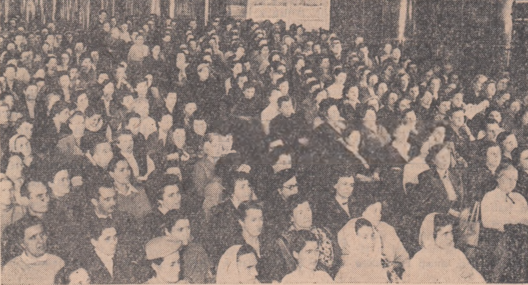
Un aspect de la Adunarea festivă din Capitală.

(Material primit în cadrul concursului corespondenților voluntari)