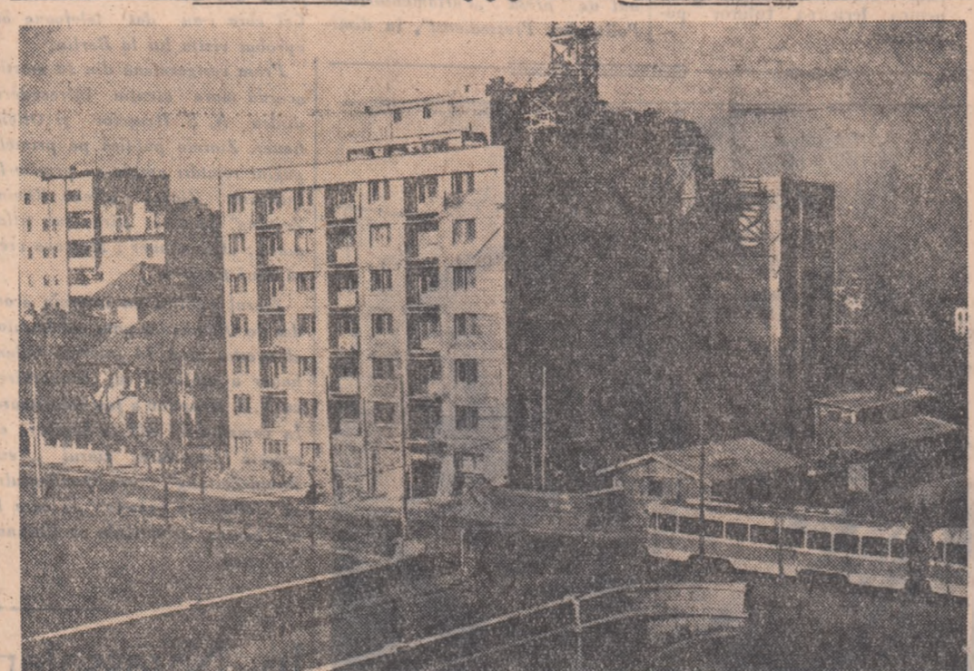
„...În 1959, din fondurile alocate de 1 miliard de lei pentru construirea de locuințe se vor putea da în folosință cu 60.000 m 2 suprafață locuibilă mai mult decît se prevede în proiectul de plan”. (Din Expunerea tovarășului Gheorghe Gheorghiu-Dej la ședința plenară a C.C. al P.M.R. din 26-28 noiembrie 1958). În fotografie: unul din noile blocuri care se construiesc pe Splaiul Independenței din Capitală.

de la Fabrica de hîrtie Buzănești, Școala profesională Petrochiu nr. 1 Cîmpina, comuna Bordeni, Filipiște de Tirg etc. În acest an faza raională s-a organizat în orașul Sînaia. Finala s-a bucurat de o bună apreciere din partea celor 4000 tineri și vîrstnici care au urmărit întrecerile celor 165 de tineri clasai pe primele locuri la fașele de concurs. Intrecerile s-au desfășurat în sălile de sport de la Casa de cultură și Clubul unsei I. C. Frînu din oraș. Pregătirea fizică și tehnică a participanților, precum și interesul manifestat de fetele care dîntre participanți au făcut ca desfășurarea concursului să se ridice la un înalt nivel. Merită să scoatem în evidență rezultatul tînarului Popenel Damian, muncitor la Fabrica de hîrtie Buzănești, care participă pentru prima oară la faza raională, a reușit să ocupe locul I la șah. Bine pregătita s-a prezentat și tovarășa Dulamă Maria din orașul Buzănești care a cucerit locul I în întrecerea de șah rezervată fetelor. Iată acum rezultatele celor 165 de tineri clasai pe primele locuri la celelalte discipline. Tenis de masă fete: Jianu Paula de la colectivul sportiv „Voința”, Sînaia băieți: Anastasiu Anatane din Poiana Cîmpina, trîntă pînă la 55 kg.: Savu Stelian colectivul „Carpați”-Sînaia; 55-61 kg.: Gheorghe Cotacu „Carpați”-Sînaia; 61-68 kg.: Nicolae Ion „Tînarul petrolist” din Cîmpina. MARIN FENICHIU președintele comisiei raionale a Spartachiadei GHEORGHE BADOI