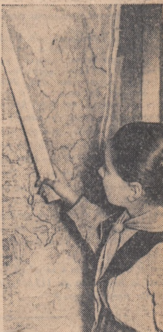
V. Ana din clasa a 6-a a școlii medii Drăgănești regiunea Pitești este una din elevele frumuse.