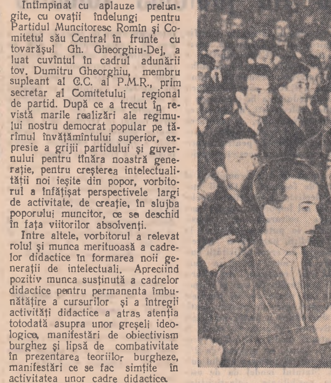
La adunarea din sala Teatrului Național „V. Alecsandri” din Iași

hotărîrea de a fi mai mult alături de studenți, de a contribui mai mult la munca educativă prin procesul de învățămînt și prin activitatea depusă în afara procesului de învățămînt. Numeroși vorbitori au dezbătut larg sarcinile care au reieșit din documentele Conferinței Naționale a U.A.S.R., din cuvîntarea tovarășului Gh. Gheorghiu-Dej și pe care studenții și profesorii s-au angajat să le îndeplinească, astfel ca de pe băncile facultăților ieșene să plece specialiști cu o înaltă calificare, cu un înalt profil moral, înarmați cu ideologia clasei noastre muncitoare, militanți neobosiți pentru politica partidului nostru.