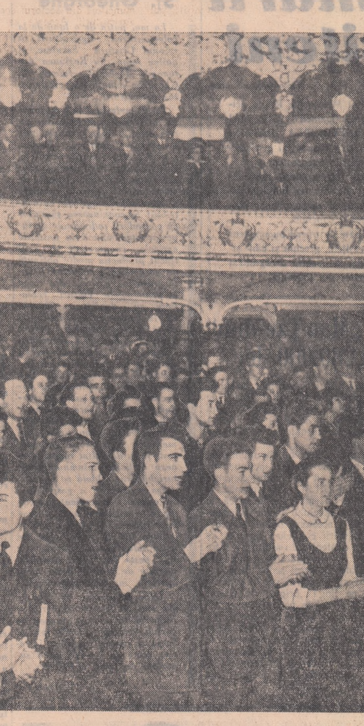
La adunarea din sala Teatrului Național „V. Alecsandri” din Iași

gată de specialitate pentru care se pregătesc. Studenții secției tehnologia prelucrării la cald și-au luat amănunțit în discuție și-au ajutat la sfîrșitul anului de studii la elaborarea a cel puțin 4 sarcini în cadrul uzinei „Steagul Rosu”, iar studenții Facultății de silvicultură vor executa lucrări de împăduriri pe o suprafață de cel puțin 30 de hectare. Brișazi-le de muncă patriotică vor ajuta la construirea a două blocuri de locuințe, executînd muncile de mare volum etc. Spiritul în care s-au desfășurat