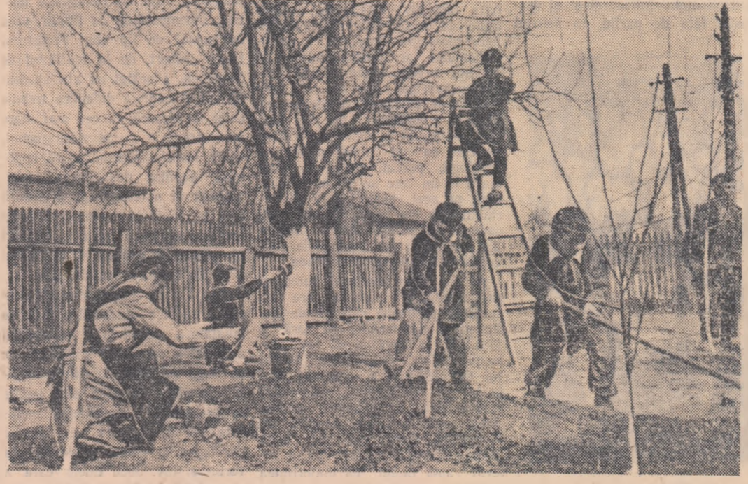
La Școala nr. 112 de 7 ani din Capitală, copiii au folosit primele zile favorabile pentru a lucra în grădina.