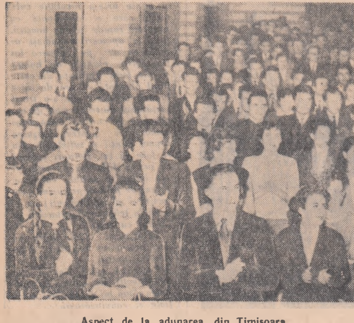
Aspect de la adunarea din Timișoara