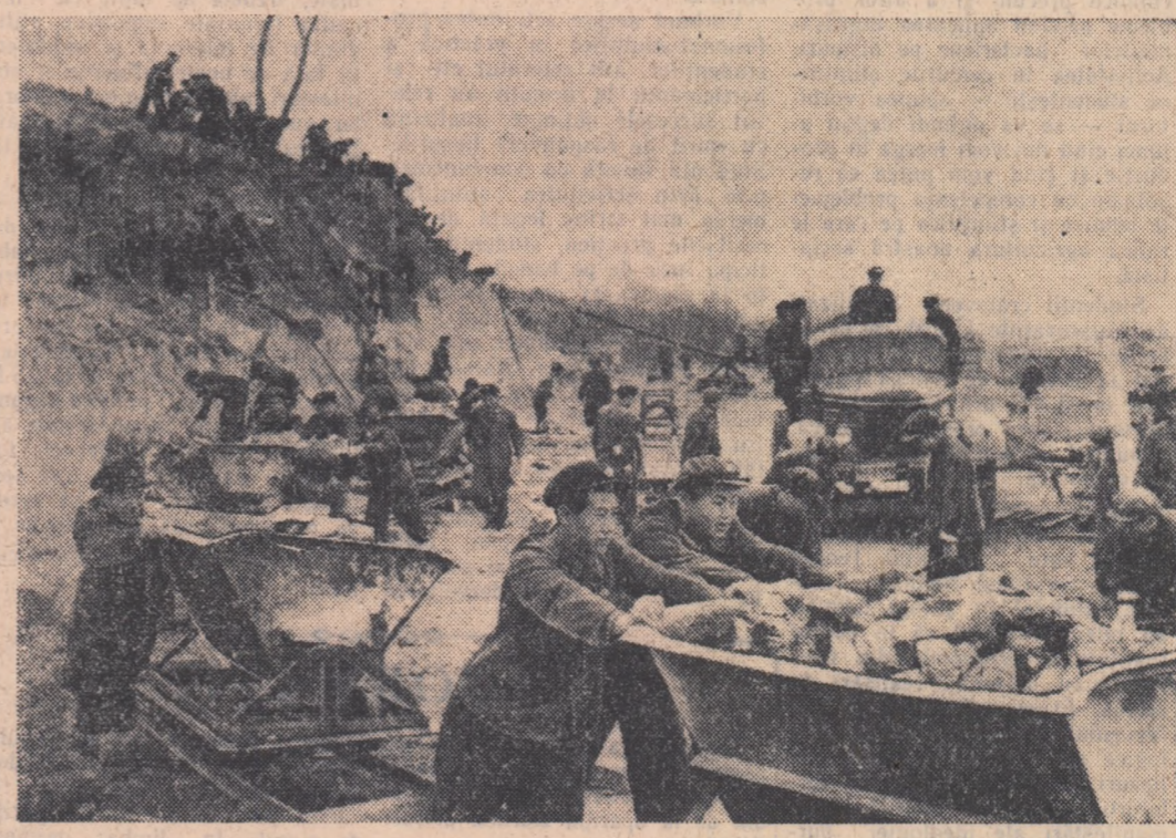
In fotografie: Studenții ai Institutului pedagogic din Phenian, participînd la muncă voluntară pe un șantier al construcțiilor de locuințe.

PARIS 13 (Agerpres). — Recent s-a inaugurat în Palatul Bursei din Nantes cel de-al patrulea Locs internațional de artă fotografică, la care participă artiștii fotografi din 25 de țări. Un loc important este rezervat lucrărilor artiștilor fotografi din R. P. Romîna, care participă cu 22 de fotografii. Cele trei panouri romînești se bucură de o deosebită apreciere din partea vizitatorilor.