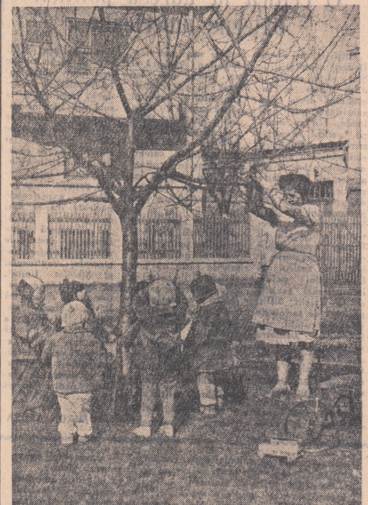
A venit primăvara. Copiii muncitorilor de la I.P.R.O.F.I.L. București se joacă mângâiați de razele soarelui în grădina din fața creșei.

Regiunea Constanta a terminat prima pe țară însămânțarea floarea-soarelui, depășind suprafața planificată cu 6 la sută.