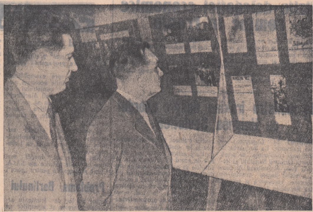
leri s-a deschis în Capitală expoziția „A 40-a aniversare a proclamării Republicii Sovietice Ungare”. În fotografie: vizitatorii urmăresc cu interes materialele prezentate în această expoziție.

Dale carnavalului — Patria, București, înfrățirea între popoare, Libertății; Voluntarii — Republica; I Mai; Un cântec din cântec — Magheru; I. C. Frimu; Moralitatea d-nei Dulca — V. Alexandru; Lumina; Gh. Doja; Flacăra; Visul spăbănat — Central; Arta; Patru pași în nori — 13 Septembrie; 16 Februarie; Lumea tăcerii — Maxim Gorki; Răsăritul — Victoria; 8 Martie; N. Bălcescu; Program de filme documentare și de desene animate — Timburi Noi; Alex. Popov; Izrael; Căpitanul — Tineretului; Comunistul — Grivița; Prima zi — Vasile Roată; Muna; Marinarii îndrăgoștii — Cultural; Ilie Pintilie; Călătoriile peste trei mări — 8 Mai; Cerul înfrântul — Unirea; Clubul C. T. R. „Grivița” Râște; Vraja dragostei — C. David; T. Vladimirescu; Tatăl meu actorul — Alex. Sahia; Miorla; Dezertorii — 23 August; Olga Banec; Razia — Donca Simo; Drumul Serii; Procesul se amână — Populii; Legenda dragostei — M. Eminescu; Romanța periferiei — G. Coșbuc; Viața noastră — Aurel Vlaicu; G. Bacovia; Omul meu drag — B. Delavrancea; 30 Decembrie; Tamango — Clubul „Boleslav Bierut”.