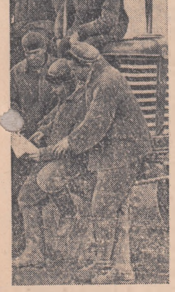
Înainte de începerea unei zile de lucru tractoriștii de la S.M.T. Radomirești din regiunea Pitești, organizează cîte o scurtă consiliere de producție. Cu această ocazie se repartizează sarcinile de producție pentru ziua în curs și se analizează rezultatele obținute în cadrul întrecerii „Pentru 430 de hantri”.

În țara noastră, industria chimică capătă o dezvoltare din ce în ce mai mare, ea contribuind la rezolvarea unor probleme deosebit de importante și actuale ale progresului tehnic, la dezvoltarea tuturor ramurilor economiei naționale. În expunerea făcută de tovarășul Gh. Gheorghiu-Dej, la Plenara C.C. al P.M.R. din noiembrie 1958, se subliniasă necesitatea de a se crea, paralel cu dezvoltarea industriei chimice, cadre capabile să minuiască utilajele moderne cu care sînt înzestrate noile întreprinderi. Pregătirea cadrelor pentru noile întreprinderi chimice, care se construiesc în țara noastră este o problemă de mare însemnătate. Ea a fost încredințată școlilor profesionale, școlilor tehnice și celor de maștri. Pentru a cunoaște cum se desfășoară pregătirea cadrelor pentru industria chimică, sîrul nostru a organizat un raid în cîteva școli de specialitate.