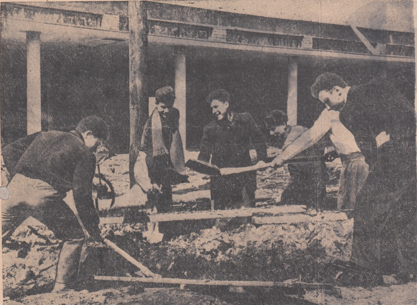
Tinerii din brigada de muncă patriotică nr. 214, formată din elevi ai Școlii profesionale a uzinei „Mao Tze-dun” din Capitală, au efectuat duminică operații de săpare la fundația unei noi piețe în cartierul Ghencea.

Anul XV, Seria II-a, Nr. 3067 4 PAGINI — 20 BANI Marți 24 martie 1959