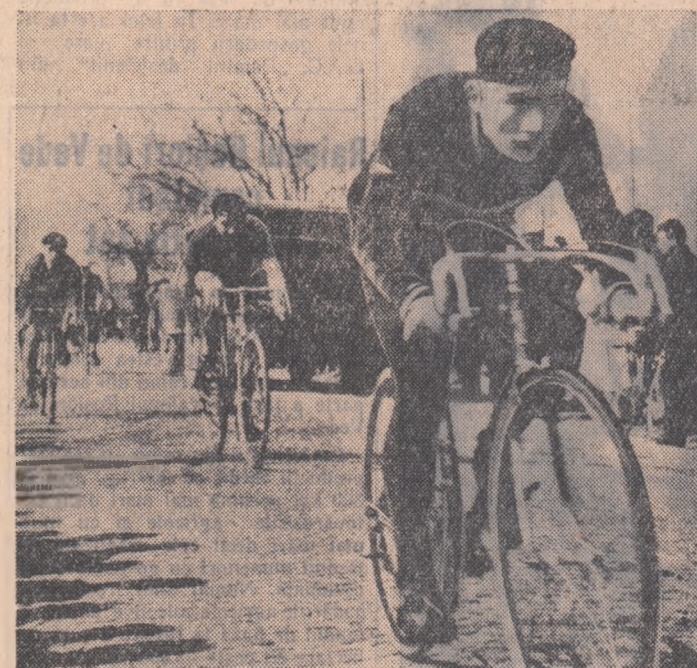
Duminică s-a desfășurat pe șoseaua Alexandria o interesantă intrecere de ciclism. Proba rezervată juniorilor — din care vă prezentăm o imagine — a fost deosebit de disputată.