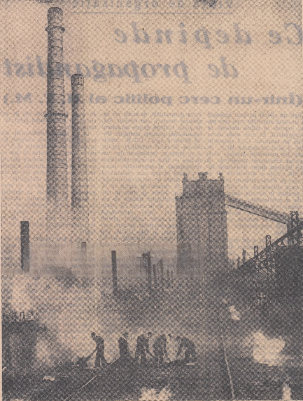
Industria siderurgică a R. P. Chineze se află în plin avînt. În anul 1959 se vor produce 18 milioane tone de oțel, cu 7 milioane mai mult ca în anul 1958. În fotografie: Coceria din Anșan, mare centru siderurgic din R. P. Chineză.