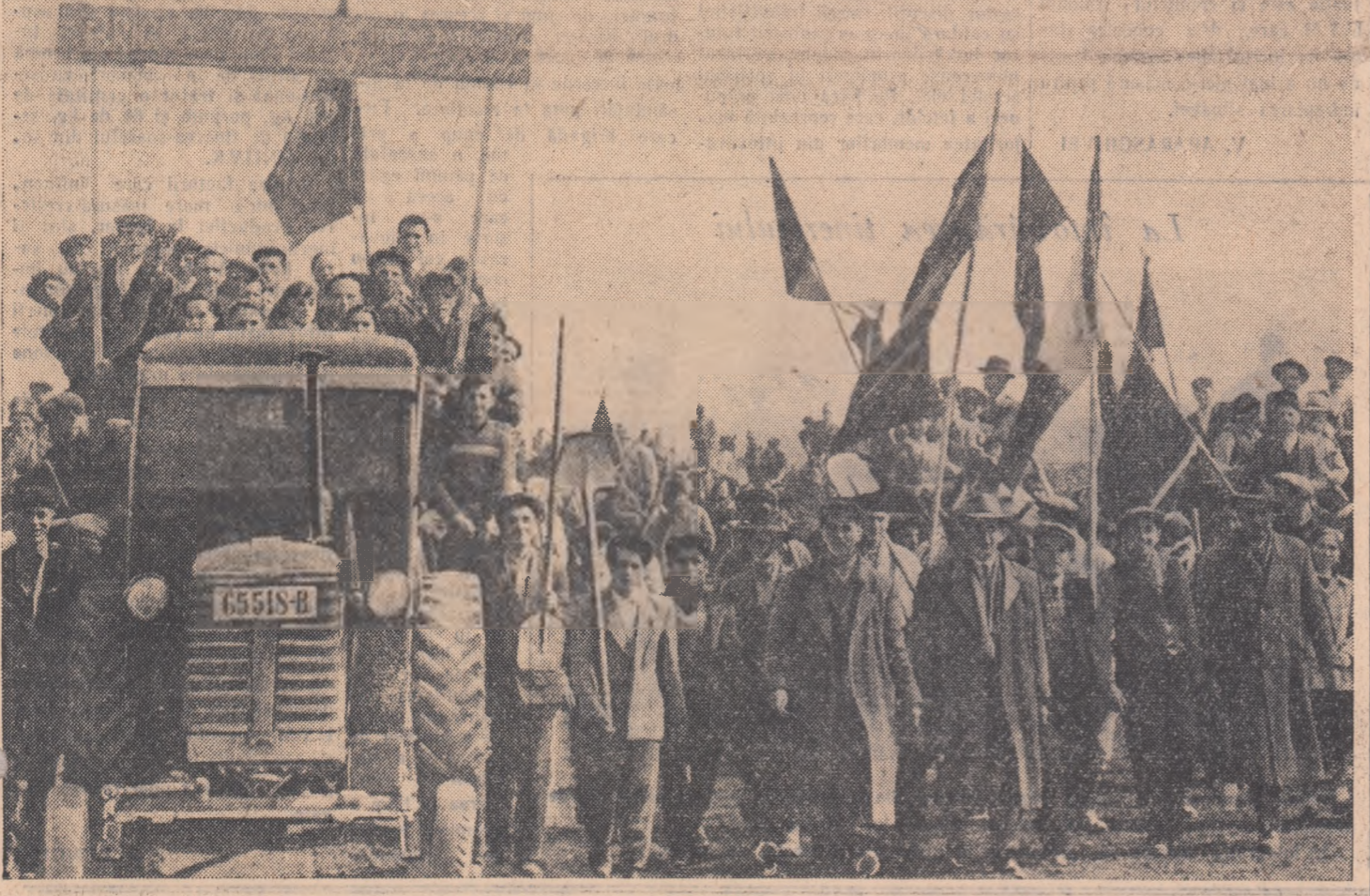
Răspunzînd cu entuziasm la chemarea Comitetului raional U.T.M. Răcari din regiunea București, 650 de tineri din satele raionului, constituiți în 21 de brigăzi utemiste de muncă patriotică, au pornit spre șantierul de hidroameliorații din comuna Săbăreni, la săparea unui canal care va feri de la inundațiile riului Săbar o suprafață de aproape 5.000 ha teren arabii.