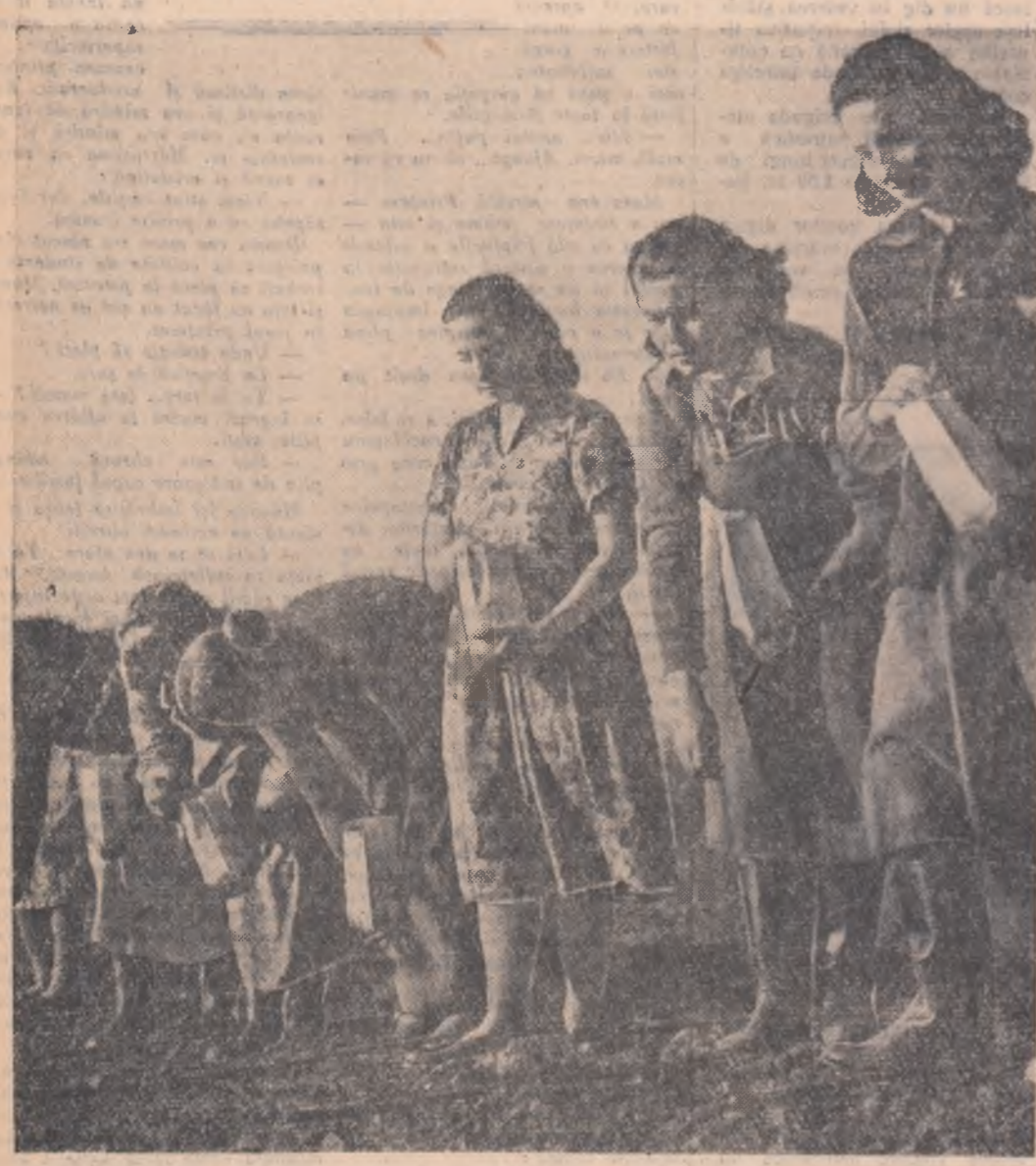
Zilele acestea brigada de tineret de la Stațiunea experimentală agricolă Tîgănești, din raionul Snagov, a început însămînțatul diferitelor soiuri de arpagic pe loturile experimentale din cîmp