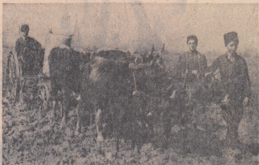
Primii locuitori din comuna Tezlu, raionul Slatina, care au ieșit în campania de primăvară au fost membrii întovărășirii tineretului „Tîrnăra Gardă”. În fotografia noastră vi prezentăm la însămînțatul sfeclei de zahăr.