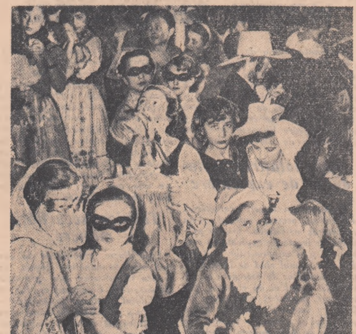
La Școala de 7 ani nr. 171 din București e mare sărbătoare. Unitate de pionieri a împlinit 9 ani de înflînțare. În fotografie: În seara aniversării, pionierii petrec ore de neuitat la frumosul lor carnaval.