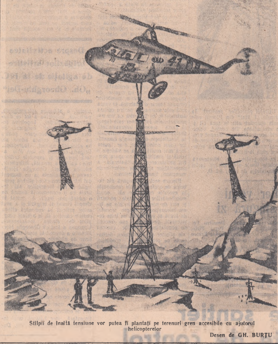
Stâlpii de înaltă tensiune vor putea fi plantați pe terenuri greu accesibile cu ajutorul elicopterelor