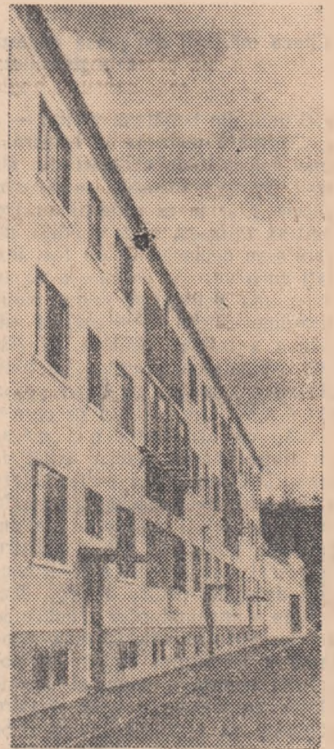
Nou bloc de locuințe pentru salariații întreprinderii SILICA — Turda.

(Material primit în cadrul Con cursului corespondenților voluntari).