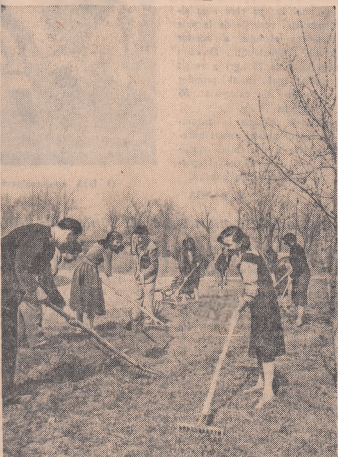
În parcul „B. Mar”, alături de elevi și pionieri, la acțiunea de îngrijire a parcului au participat și numeroși tineri din organizațiile din întreprinderi și cartiere.