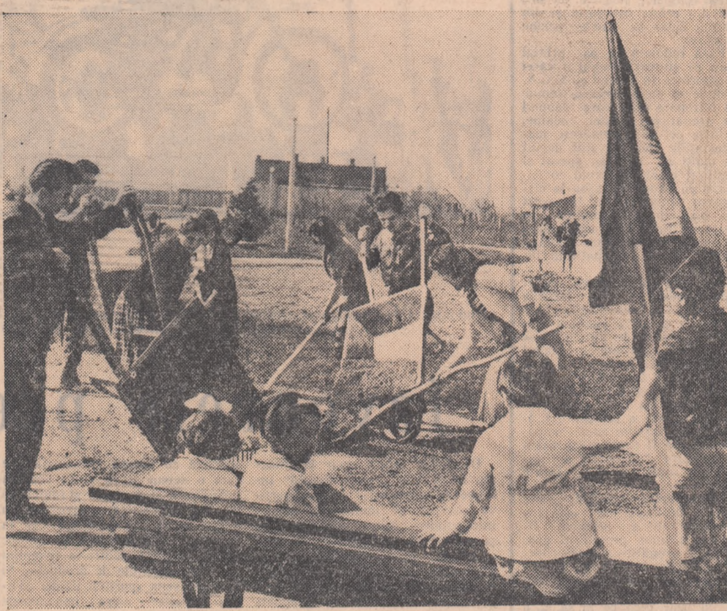
La Fundeni pe locurile unde altă dată era o groapă, azi se întinde un frumos parc. Duminică tinerii din școli și cartier au contribuit la înfrumusețarea lui.