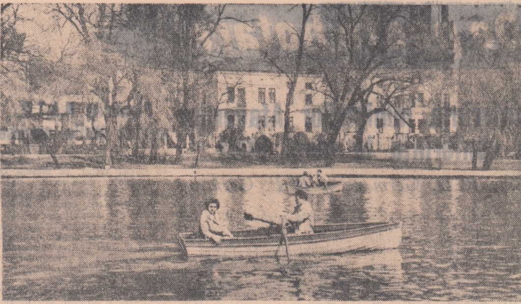
Primăvara în Clujmgiu

Fiecare utemist, tînăr țărani muncitor, intelectual de la sate trebuie să considere ca o îndatorire de onoare participarea sa activă, sub conducerea organizațiilor de partid, la munca politică pentru atragerea de noi țărani muncitori pe drumul socialismului, pentru consolidarea economică și organizatorică a sectorului socialist, pentru izbînda definitivă a socialismului la sate.