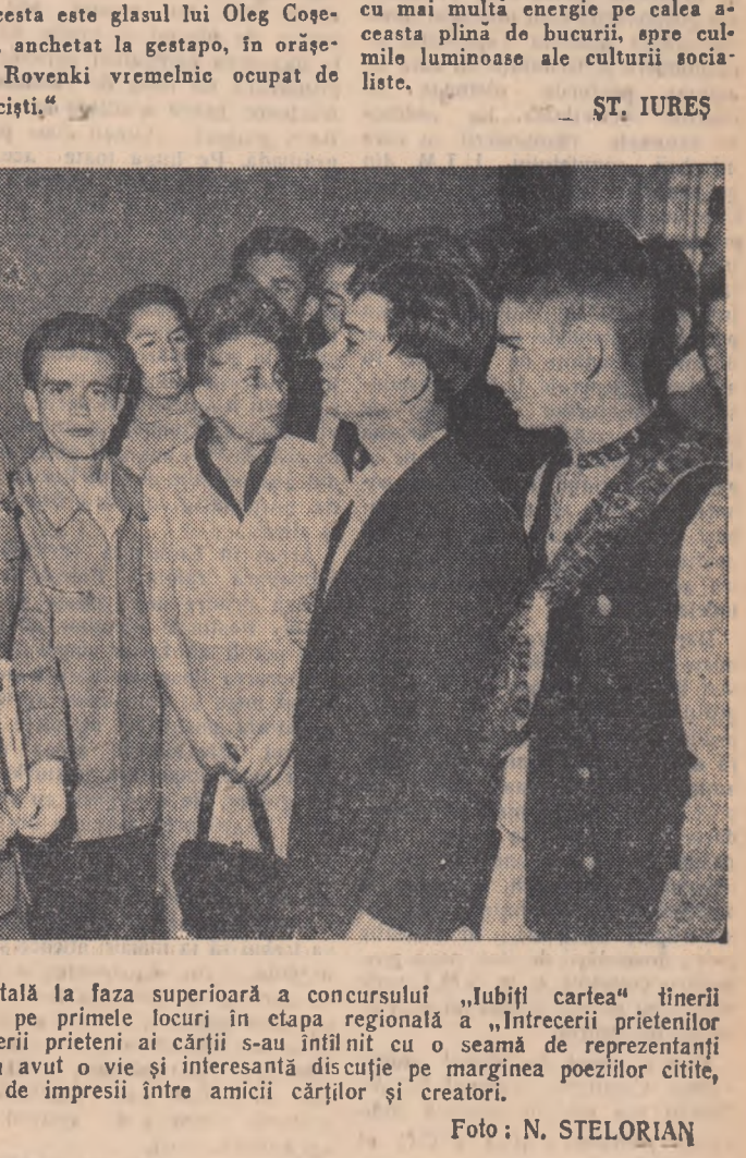
Zilele acestea s-au înfruntat în Capitală la faza superioară a concursului „Iubiți cartea” tinerii concurenți din întreaga țară clasăți pe primele locuri în etapa regională a „Întrecerii prietenilor cărții”. După predarea lucrărilor, tinerii prietenii ai cărții s-au înfruntat cu o seamă de reprezentanți ai literii noastre contemporane. Ei au avut o vie și interesantă discuție pe marginea poeziilor citite, un fructuos schimb de impresii între amicii cărților și creatori.

Succese importante în lupta pentru economii au realizat tinerii de la turnătorie. De exemplu pentru reducerea rebuturilor și economisirea fontei, s-a introdus un control sever la turnare. În ultimul timp, tinerii de la întreprinderea „Ludovic Minschi” au propus numeroase inovații și raționalizări dintre care 17 au și fost acceptate și aplicate în practică. Un punct important din angajamentele luate a fost însă neglijat: stringerea fierului vechi. Comitetul U.T.M. trebuie să ia măsuri ca toate acțiunile pentru realizarea obiectivelor prevăzute în angajamentele organizației de bază U.T.M. să se desfășoare paralel și de asemenea să urmărească de pe acum felul cum brigăzile de tineret ca și fiecare utemișt și tinar în parte, își îndeplinește angajamentele individuale.