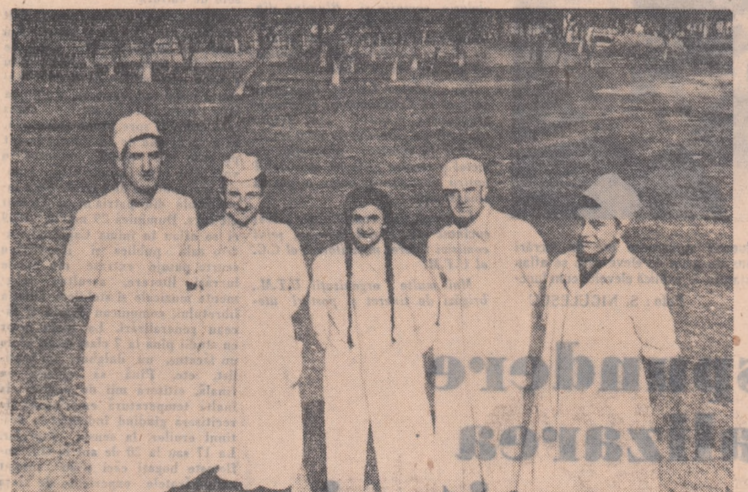
Aceștia sint tinerii care au luat în primire sectorul zootehnic din secția Micești a gospodăriei de stat Cluceasa