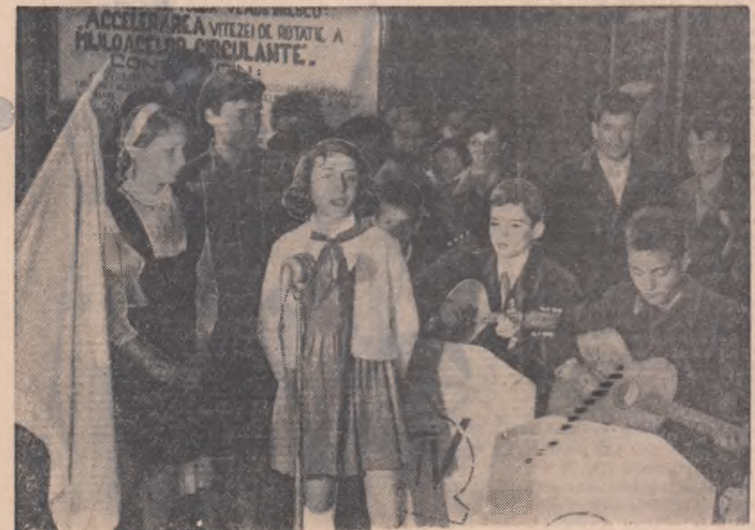
Pionierii de la Școala mixtă nr. 111 și de la casa de copii „Traian Vorod” patronați de uzinele „Tudor Vladimirescu” au dat într-o pauză un spectacol la locul acestei uzine.