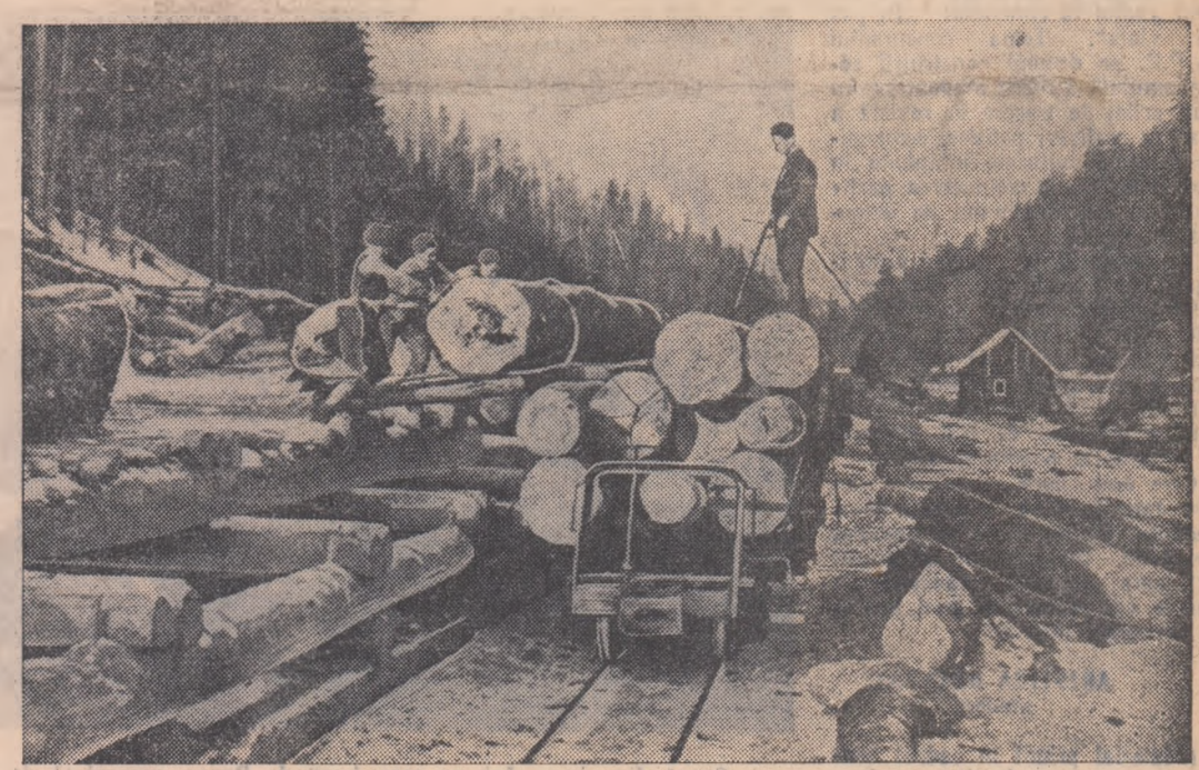
Tinerii țapinari de la gura de exploatare Moldova-Sebeș sînt vrednici mînuitorii ai țapinel. Patru tineri pot conduce din țapină bușteni ce ajung pînă la 4-5.000 kg. Iată-l încercînd ultimul vagon al unei noi garnituri cu bușteni ce vor lua drumul industrial.