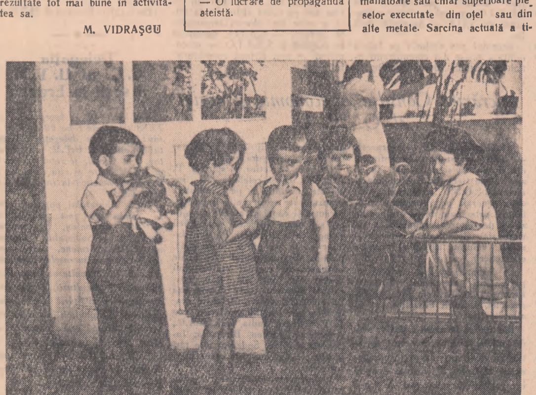
Greșă și căminul uzinelor textile „7 Noiembrie” din Capitală sînt dotate cu toate cele necesare pen- tru educarea și distracția copiilor. — Fotografie: aspect de la creșă săptămînală și de zi a uzinelor „7 Noiembrie” din Capitală.

La ambasada Republicii Popu- lare Bulgaria a avut loc joi o con- ferință de presă în cadrul căreia ambasadorul R. P. Bulgaria a vorbit București, Stoian Pavlov, a vorbit despre însemnătatea și semnificația hotărîrilor adoptate la cea de-a III-a sesiune ordinară a Adunării Populare a R. P. Bulgaria. După expunere, tov. Stoian Pa- vlov a răspuns la întrebările puse de ziariști. (Agerpres)