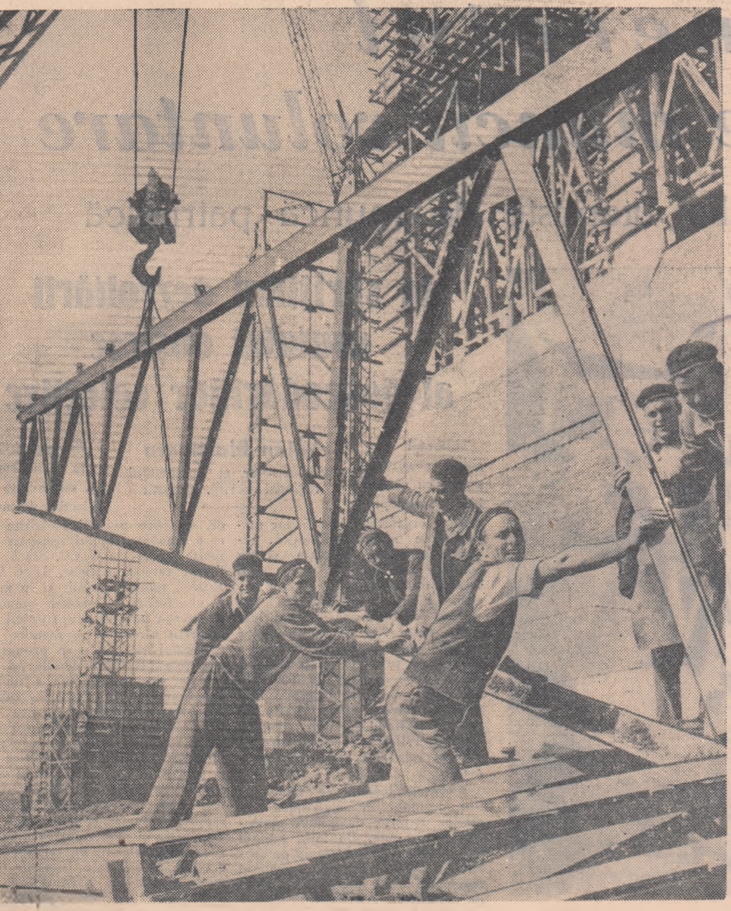
Constructorii și montorii de pe șantierele uzinei de sodă de la Govora antrenați în întrecere în cinstea zilei de 1 Mai grăbesc ritmul lucrărilor.