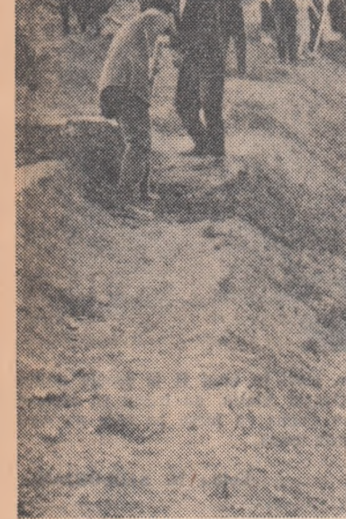
Brigăzile utemiste de la atelierul C.F.R. Ploiești lucrind la taluzarea brațului nordic al viitorului lac care se amenajează în parcul de cultură și odihnă de la Bucov.

Tinerii au hotărît cu însuflețire să participe la amenajarea și