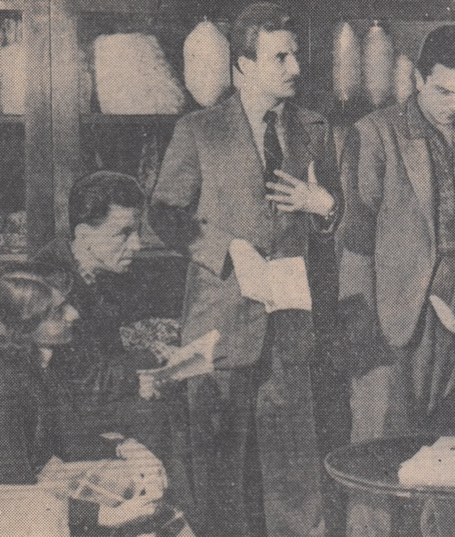
Brigada artistică de agitație de la „Industria Bumbacului A” din Capitală, se pregătește pentru cel de-al V-lea concurs pe țară. În fotografie: un aspect de la una din repetițiile brigăzii.