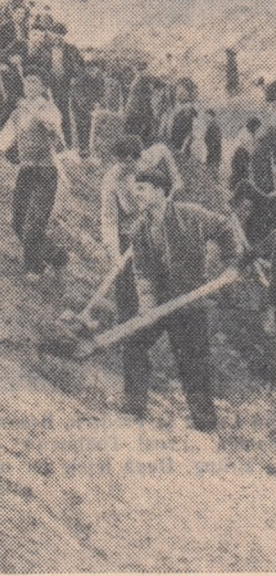
Brigăzile utemiste de la atelierul C.F.R. Ploiești lucrind la taluzarea brațului nordic al viitorului lac care se amenajează în parcul de cultură și odihnă de la Bucov.

Tineretului îi este caracteristică veselia, entuziasmul. La muncă patriotică — mai mult ca oriunde