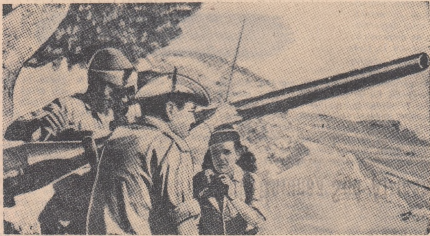
Tînăra generație a Algeriei este mîndră de rolul pe care-l are în cadrul Armatei de eliberare națională. În fotografie: tineri algerieni pe front, în războiul împotriva colonialiștilor.