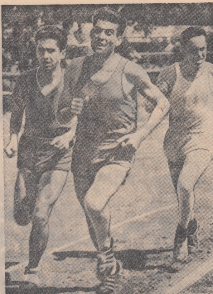
Vă prezentăm un aspect al probei de 3.000 m. bărbați...