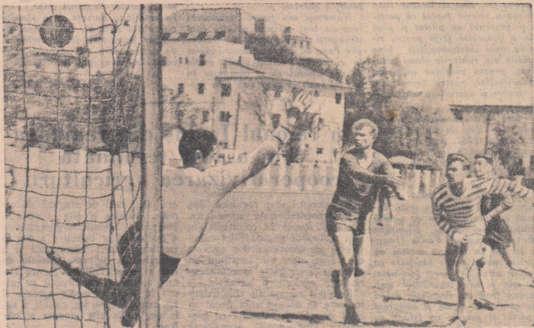
Cu toată intervenția spectaculoasă a portarului militar...