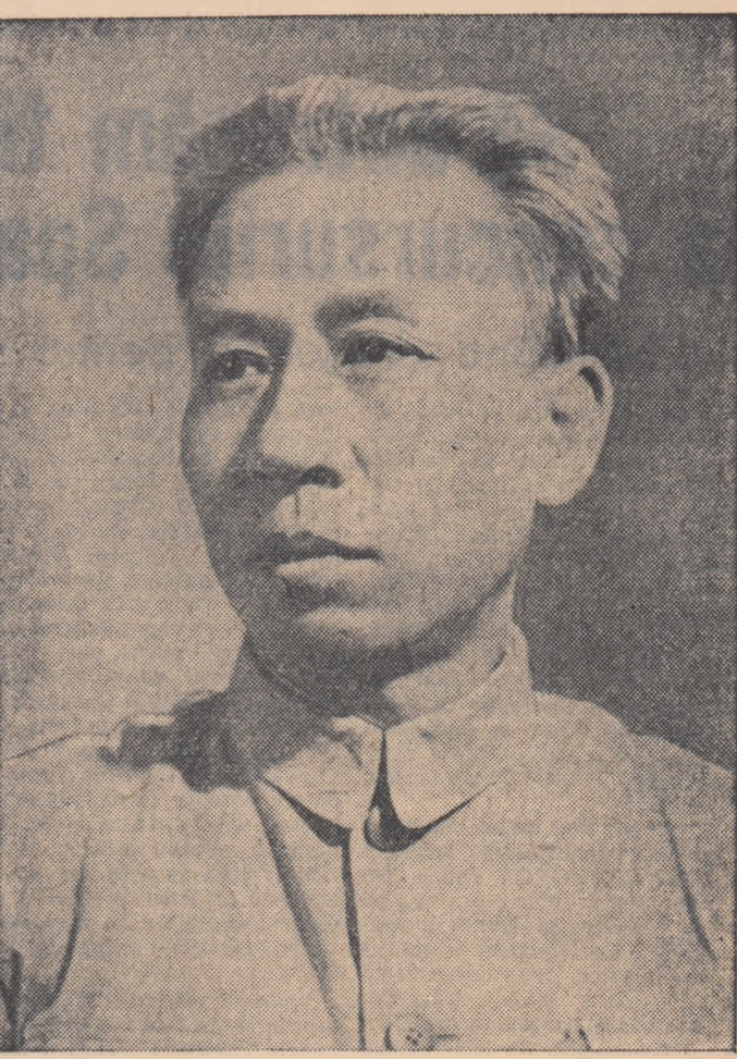
PEKIN 27 (Agerpres). — China Nouă transmite: