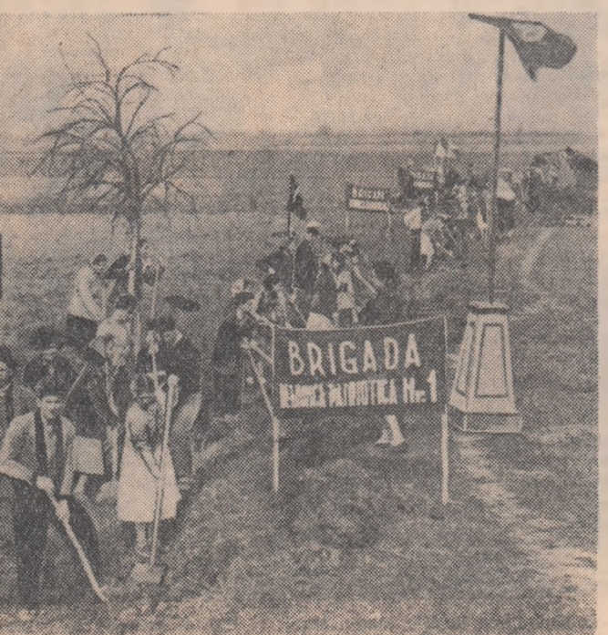
Brigăzile utemiste de muncă patriotică în plină activitate pe șantierul de hidroameliorații de la Becicherecul Mic.