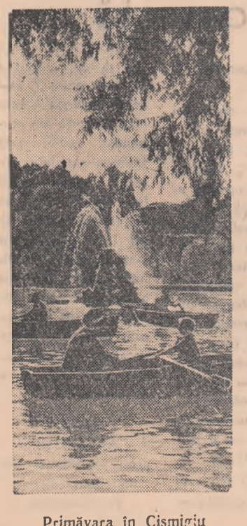
Primăvara în Cișmigiu