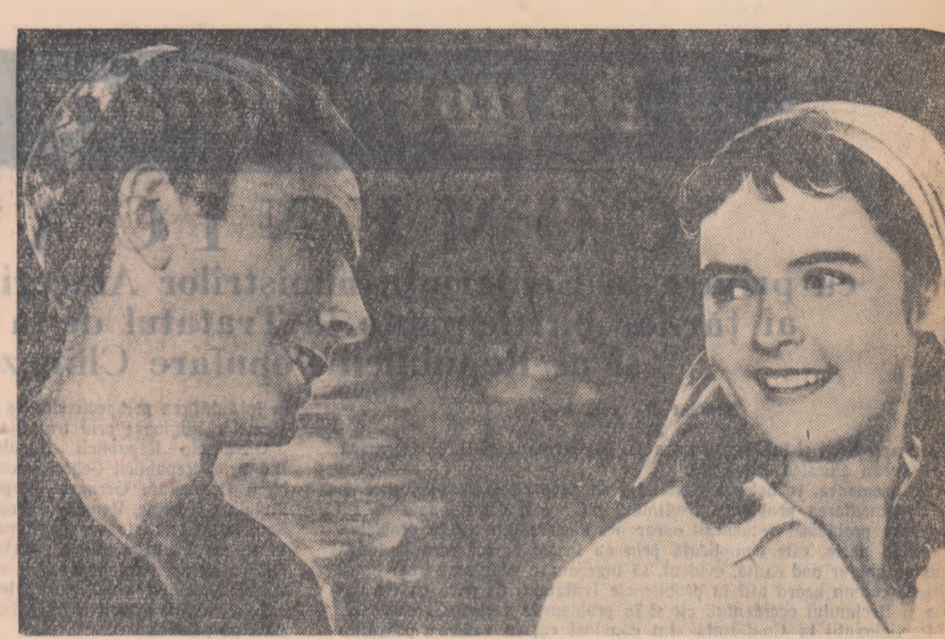
O scenă din filmul „Steaguri pe turnuri”