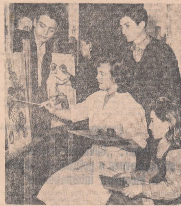
În cercul de artă plastică al Casei de cultură de pe lângă Combinatul metalurgic Reșița

Artistul sovietic va dirija de asemenea mai multe concerte simfonice la Timișoara, Cluj și Arad.