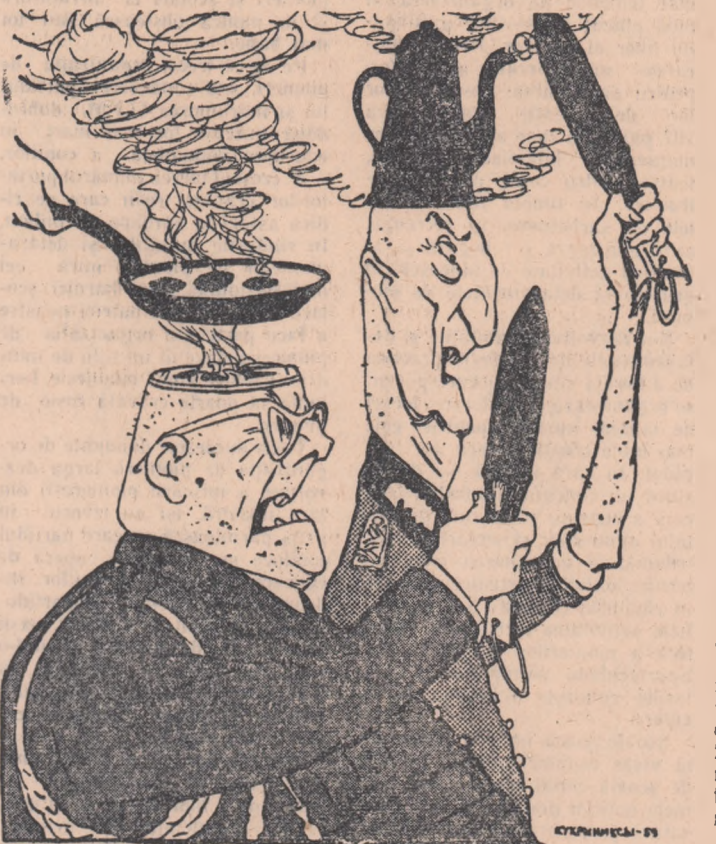
Proiect pentru folosirea rațională a „capetelor înfierbîntate“ Caricatură de KUKRINKSI din „Pravda“

WASHINGTON. — Secretarul de stat al S.U.A., Herter, a părăsit la 27 aprilie Washingtonul plecînd cu avionul la Conferința miniștrilor Afacerilor Externe ai celor patru puteri occidentale, care va începe la 29 aprilie la Paris.