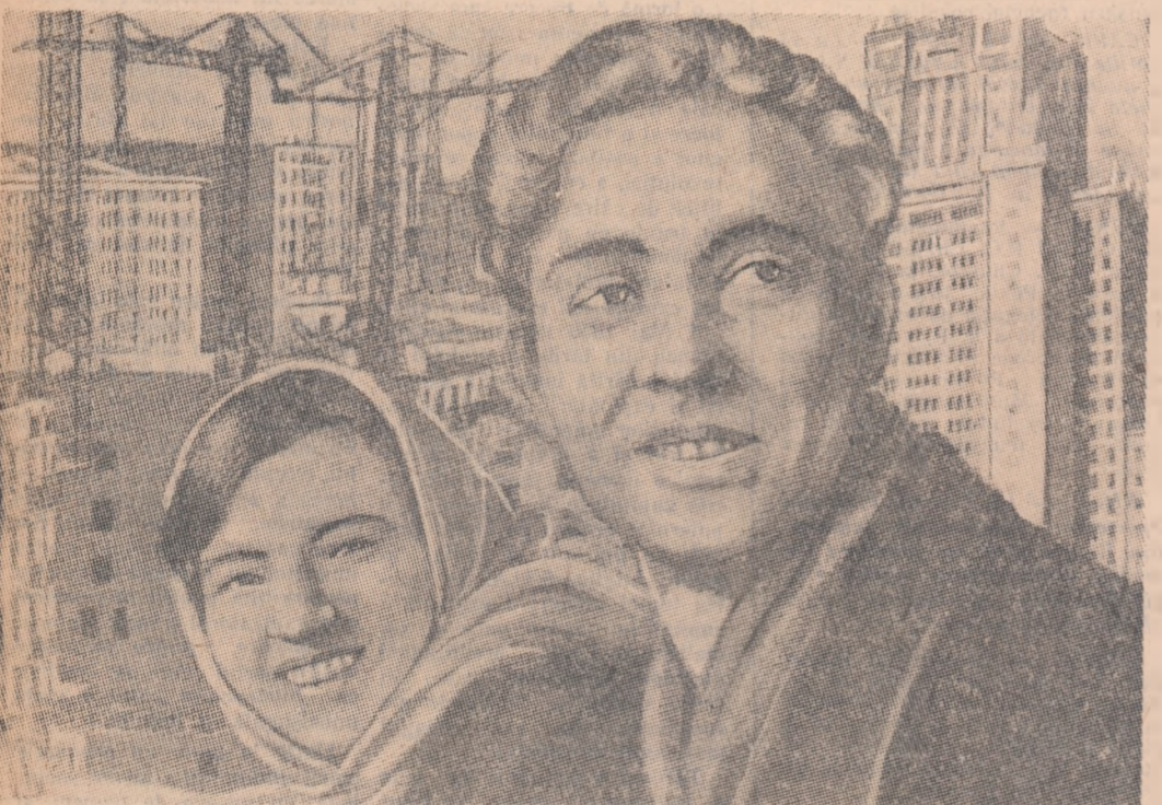
Tinerete fericită, pe șantierele construcției comunismului..