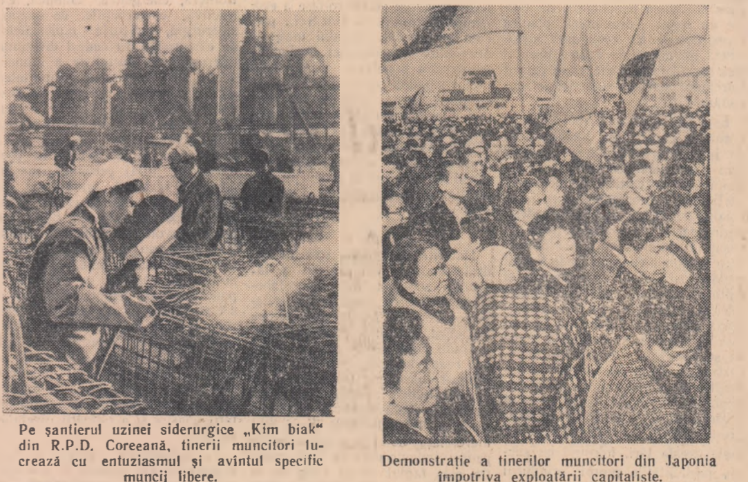
Pe șantierul uzinei siderurgice „Kim biak” din R.P.D. Coreeană, tinerii muncitori lucrează cu entuziasmul și avîntul specific muncii libere.

● În Republica Populară Chineză zeci de milioane de tineri lucrători din agricultură învață în școli medii și superioare. Comuna populară din județul Minșin, de pildă, a înființat o școală superioră frecventată de 50 de oameni, din care 30 sînt tineri numeroase instituții agricole au fost înființate în numeroase articole din regiunile muntoase, ca de pildă în provincia Hânau.