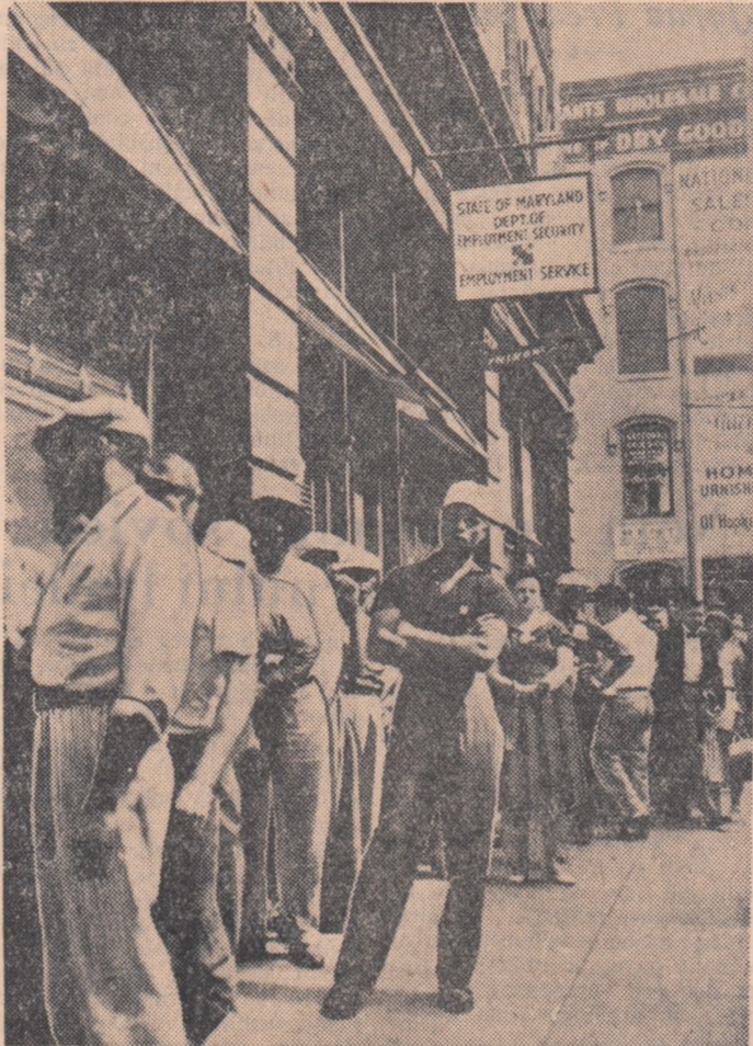
Una din nesfîrșitele cozi de șomeri în fața unui din miile de oficii de plasare din S.U.A.

Copii flămînzii, copiii goi, copiii abandonatî de părinți ca să beneficieze de „mită” publică, sînt cu miile în S.U.A. Societatea în care trăiesc le fură zîmbetul, bucuriile vieții, pentru că părinților lor le fură munca.