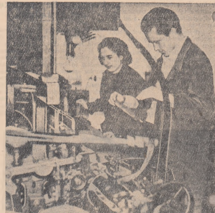
În Institutul politehnic din Iași s-a deschis o fabrică producătoare de țesături și tricotație în care lucrează studenții. În fotografie: un aspect din timpul lucrului.