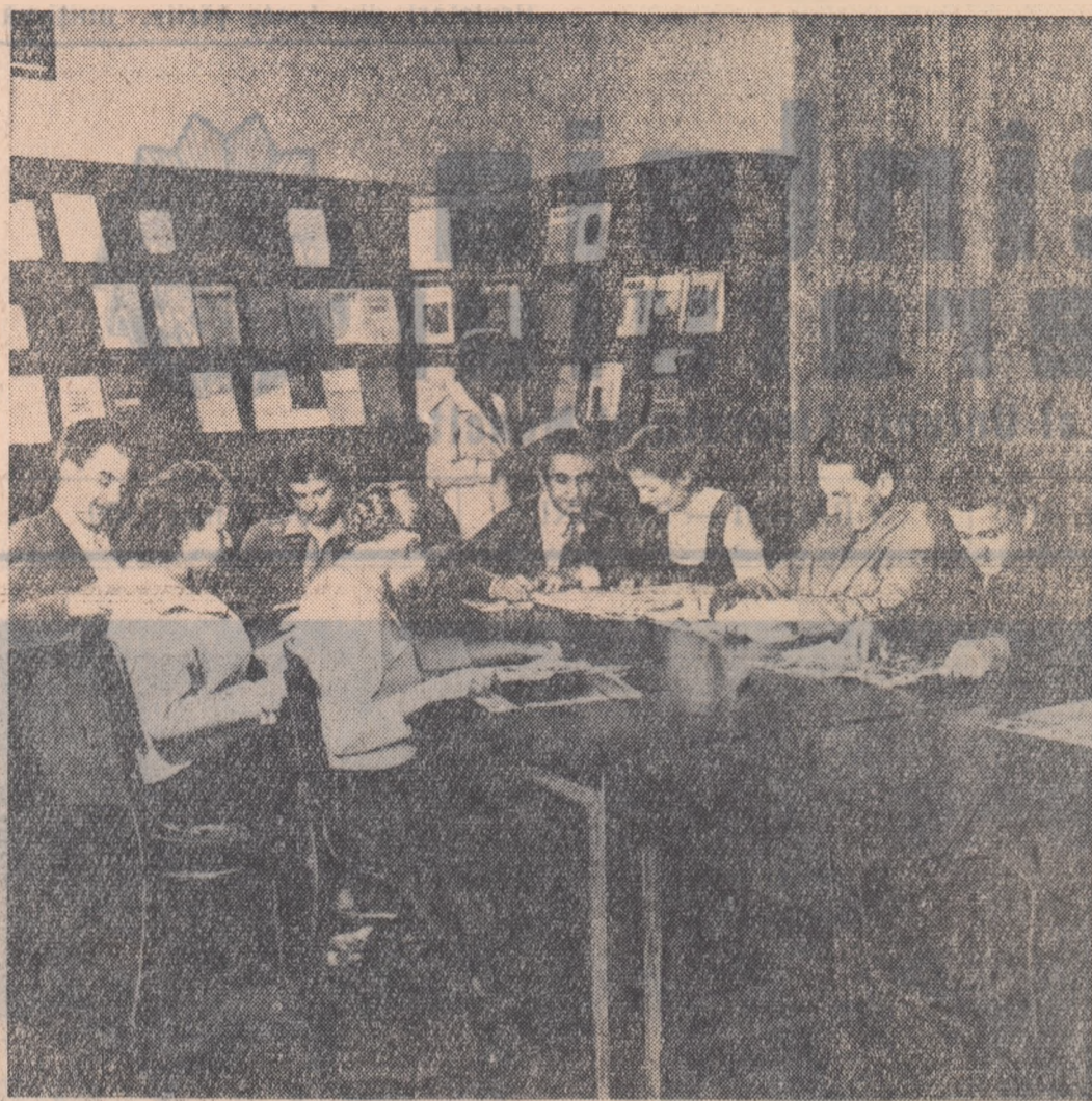
Biblioteca universitară din Cluj se mîndrește cu un mare număr de cititori din rîndul studenților. Ei găsesc în această bibliotecă un nesecat izvor de cunoștințe.