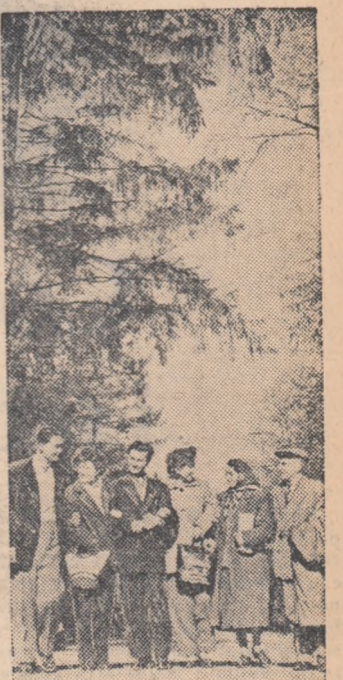
Tineri muncitori la odihnă în stațiunea Buziaș