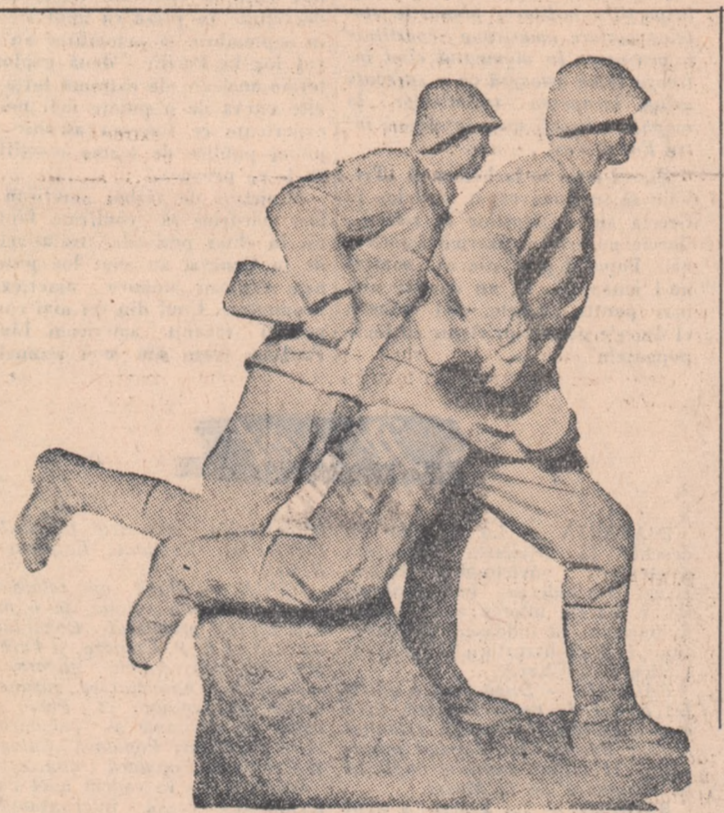
Sculptură de Cristea Grossu — Frăția de arme Romîno-Sovietică

Conferința a fost audiată cu viu interes.