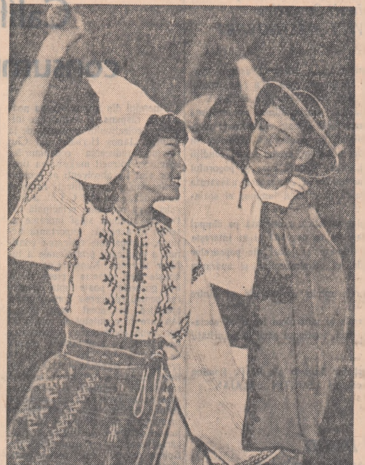
Tinerii de la Șantierul naval maritim din Constanța se pregătesc pentru cel de-al V-lea concurs pe fară al echipelor artistice de amatori.

Comitetul orașeneș U.T.M. București este holărit să și intensifice activitatea educativă lichidarea acestor lipsuri, pentru mobilizarea tuturor tinerilor la acțiunile care vor urma, pentru generalizarea experienței bune dobîndite cu acest prilej, astfel încît festivalul orașeneș — pe care-l dorim o adevărată sărbătoare a tineretului Capitală — să contribuie și mai mult la educarea comunistă a tineretului.