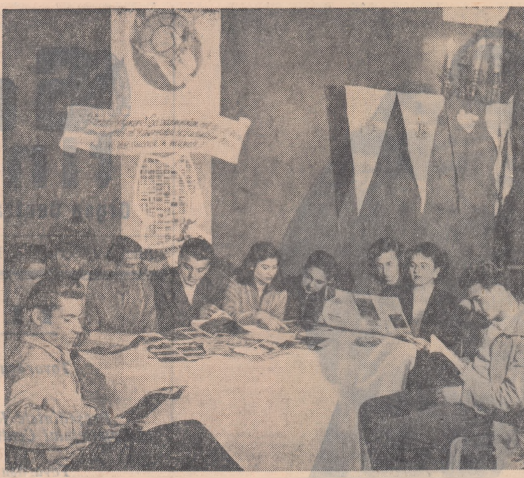
La Casa de cultură a tineretului din raionul „I. V. Stalin” din Capitală s-a deschis de curînd un frumos colț al festivalului.

— Eu — spune el — răspund de activitatea culturală, păstrarea localului și treaba afului popular. Care este cauza acestei stări de lucruri? Cum de nu putem tolera