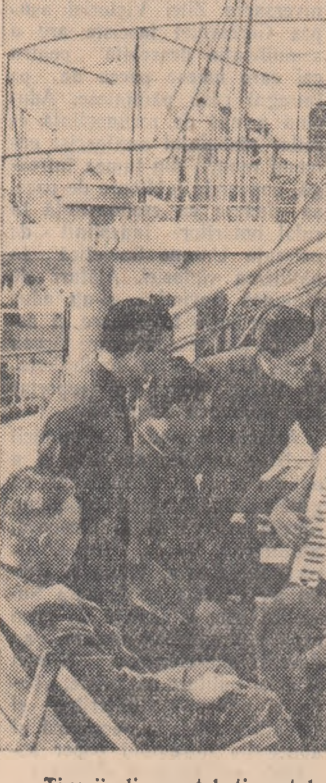
Tinerii din cartul tineretului pe puntea C. a motonaveli „Transilvania” învață un nou cîntec