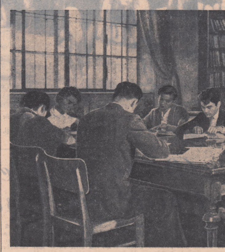
In biblioteca Facultății de Medicină din București

Peste tot, pe întreg cuprinsul patriei noastre tinerii se pregătesc să participe la Festivalul Mondial al Tineretului și Studenților, sărbătorește a tineretului și prieteniei între popoare.