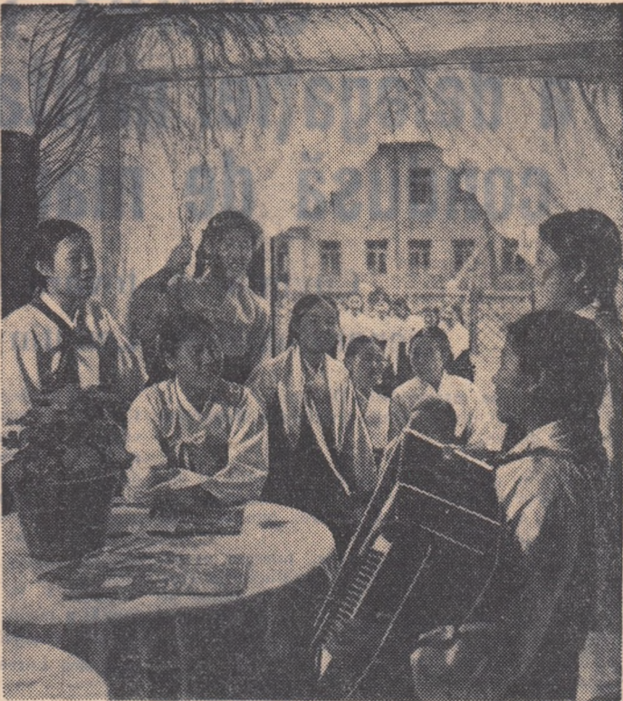
Tinerii muncitori din cadrul Combinatului Textil din Phenom își sa-au creat condiții minunate de a se distru în timpul liber.

Din tot ceea ce se cunoaște despre evenimentele din Tibet, reiese limpede că aceste evenimente au fost provocate de elementele reacționare, dușmănoase care se împotrivesc la tot ce este nou. În ce privește Ungaria, a continuat N. S. Hrușciov, noi considerăm că acolo contrarevoluția, stimulată din străinătate, a putut să-și ridice capul în primul rând datorită greșelilor fostilor conducători ai Ungariei. Acest lucru este confirmat și de faptul că într-o perioadă scurtă de timp Ungaria și-a vindecat rănilor provocate de contrarevoluție, iar în prezent poporul ungar este mai unit ca niciodată în jurul guvernului și partidului său.