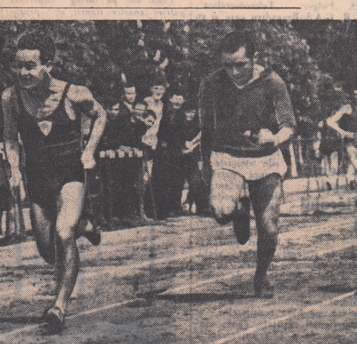
Simbăza și duminică sute de elevi au luat startul în întrecerile prilejuite de „Ziua atletismului școlar”. Vă prezentăm o imagine din timpul probei de 100 m. bărbați, disputată pe Stadionul tineretului din Capitală.

Echipa reprezentativă de tenis a R. P. Romîne a reușit o admirabilă victorie, eliminînd cu 3-2 puternica formație a Noii Zeelande din competiția dotată cu „Cupa Davis”. După desfășurarea meciului de dublu de sim-băza puținii mai erau aceia care sperau într-o victorie finală a reprezentativei noastre. Duminică însă, jucătorii romîni Gheorghe Viziru și Ion Țiriac au răsturnat toate calculele obținînd două prețioase victorii. În probele de simplu care ne-au adus calificarea pentru turul trei al competiției (pentru prima oară în istoria tenisului romînesc). Acum,