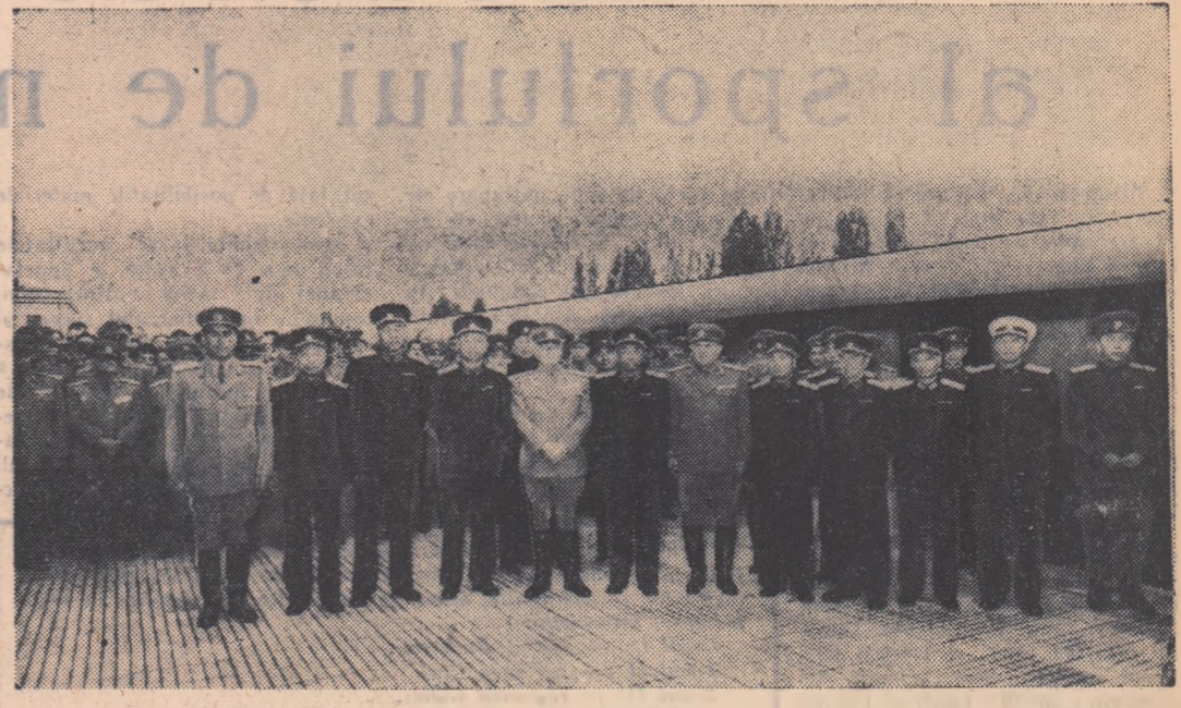
Aspect de la sosirea

Luni după-amiază a sosit în Capitală delegația militară a Republicii Populare Chineze, condusă de mareșalul Pin De-huai, membru al Biroului Politic al C.C. al Partidului Comunist Chinez.