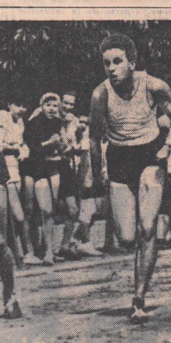
Simbăza și duminică sute de elevi au luat startul în întrecerile prilejuite de „Ziua atletismului școlar”. Vă prezentăm o imagine din timpul probei de 100 m. bărbați, disputată pe Stadionul tineretului din Capitală.

Analiza desfășurării celei de-a IV-a ediții a Spartachiadei de iarnă a tineretului, efectuată zilele trecute de către Comisia centrală de organizare a spartachiadei în prezența șefilor comisiilor sportive a comitetelor regionale U.T.M. și a președinților organelor regionale U.C.F.S., a oferit un bun prilej de a constata actualul stadiu de desfășurare a întrecerilor din cadrul primei etape a Spartachiadei de vară a tineretului organizată în cînsălea celei de-a XV-a aniversări a eliberării patriei noastre de sub jugul fascist. Deosebit de îmbucurător este faptul că în întreaga țară întrecerile au început să se des-