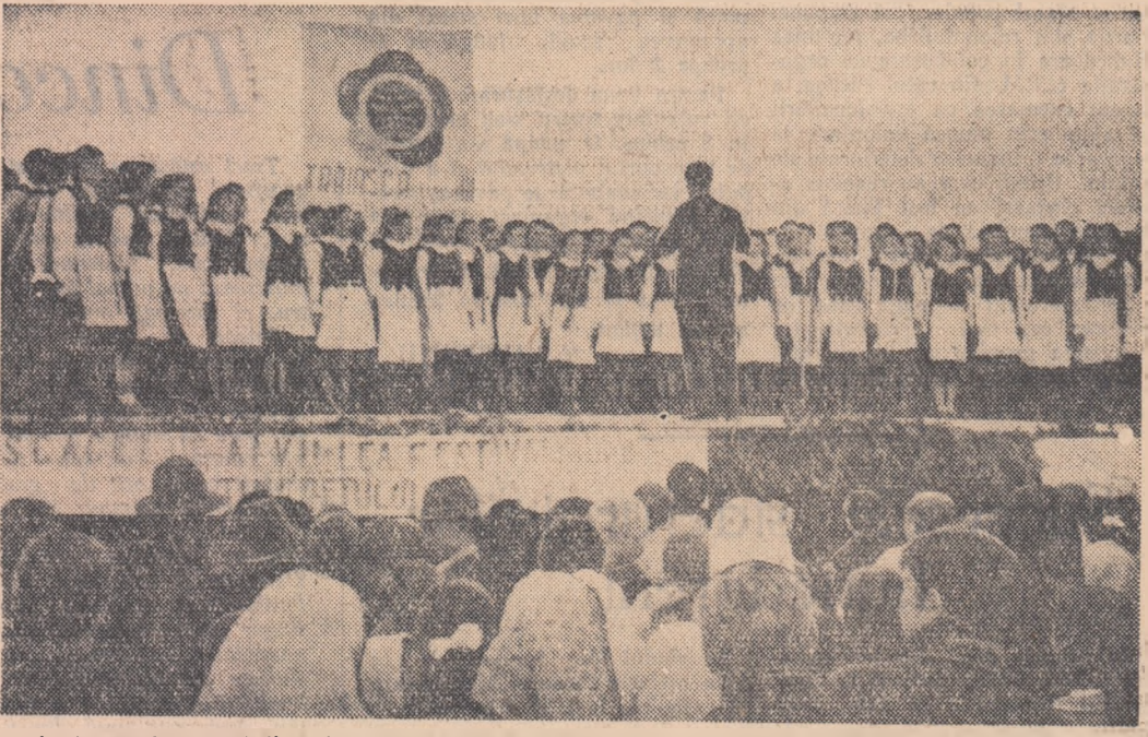
La festivalul tineretului din raionul Ciuc, corul din Armășeni a prezentat un bogat program de cîntece patriotice și revoluționare și de cîntece populare.

MIRCEA MOLESCU secretar al Comitetului orașenesc U.T.M. Bacău