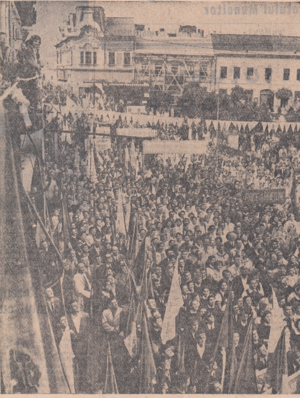
La deschiderea festivalului tineretului din orașul și raionul Lugoj.