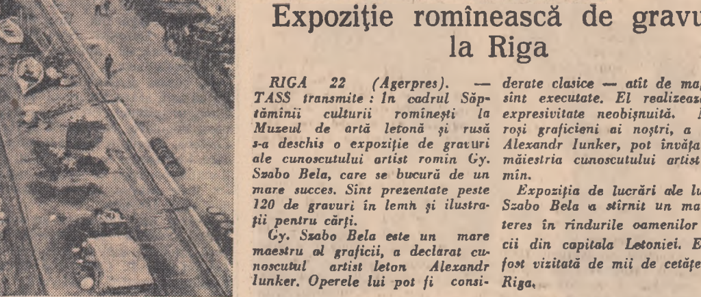
Cheful celui mai mare șantier naval cehoslovac de la Komarno, „Slovenske Lodenice”. În ultimii ani, șantierul și-a mărit neîncetat producția.

DELEGAȚIA SOVIETICĂ CONSIDERĂ NECESAR SA DECLARE CA TERGIVERSAREA PE VIITOR A REZOLVĂRII ACESTEI PROBLEME IMPORTANTE PENTRU POPOARELE POLONEI ȘI CEHOȘLOVACIEI ȘI PENTRU SUCCESUL CONFERENCEI, NU POATE FI JUSTIFICATĂ CU NICI O DELEGAȚIA SOVIETICĂ SPERĂ CĂ ÎN ZILE URMĂTOARE EA VA FI REZOLVATĂ ÎN MOD POZITIV.