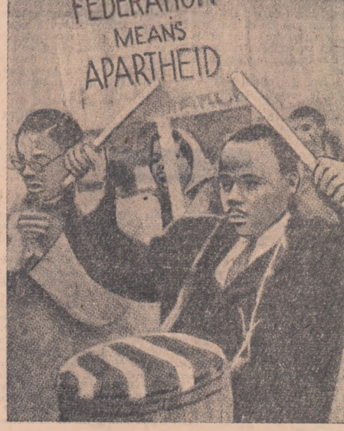
Un tânăr african bîntind toba se află în fruntea demonstrației de la Londra la care au participat peste 1.000 de persoane, demonstrație îndreptată împotriva făedelegerii colonialiștilor englezi în Niassala nd

Forma și conținutul „planului global” Desen de M. Abramov