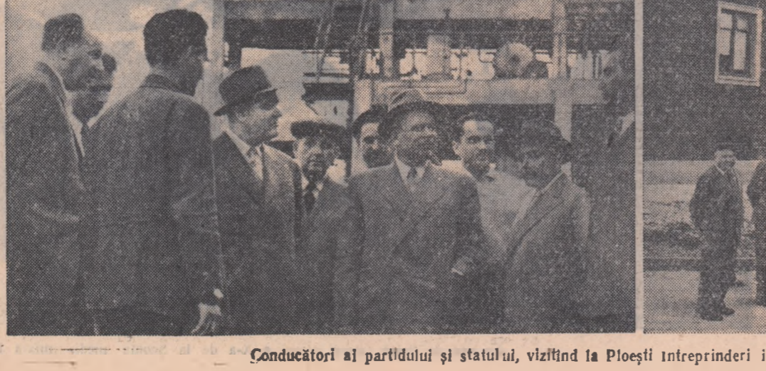
Conducători ai partidului și statului, vizitînd la Ploiești întreprinderi industriale și noi blocuri de locuințe

In întreaga țară se întreprind numeroase acțiuni în întâmpinarea Zilei internaționale a copilului. La sate se deschid grădinițe sezoniere, unde copiii se bucură de o bună îngrijire, în timp ce mamele lor lucrează pe ogoare. In regiunea Iași, prin grija comitetelor de femei, s-au deschis 234 grădinițe sezoniere. In care sînt găzduiți peste 6.500 de copii. In regiunea Constanța multe din cele peste 340 de grădinițe sezoniere și