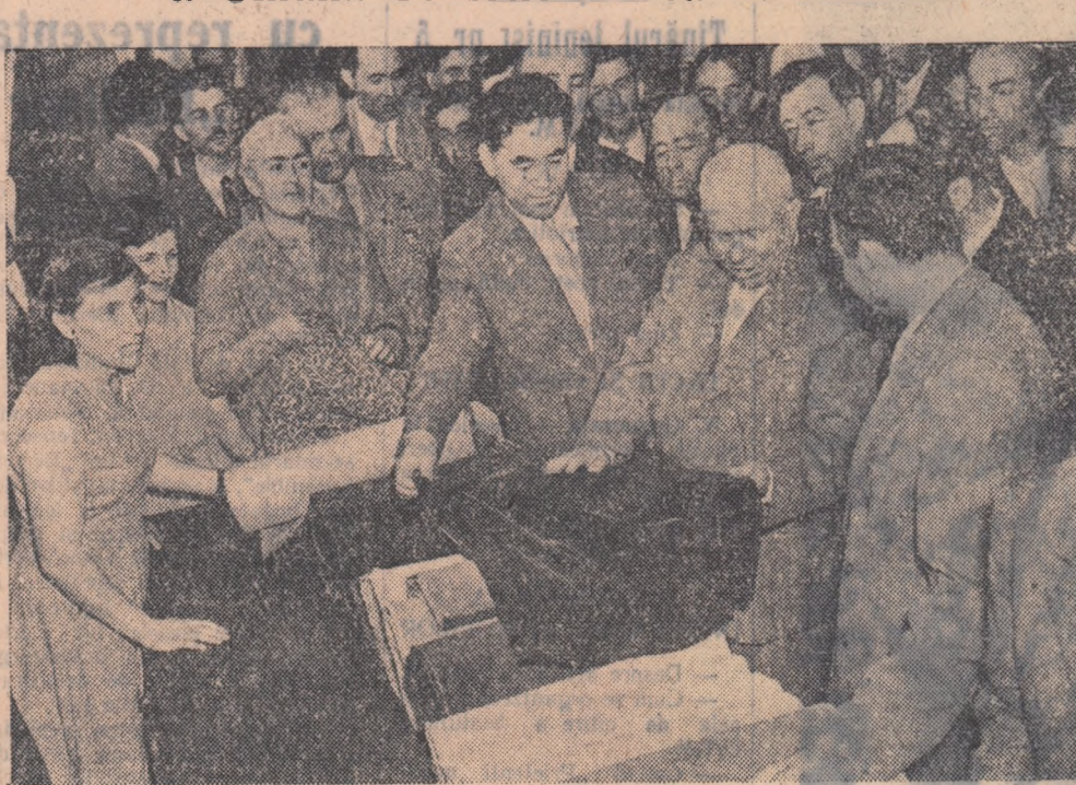
Delegația de partid și guvernamentale a Uniunii Sovietice în frunte cu N. S. Hrușciov vizitînd Comitetul textil „Stalin” din Tirana