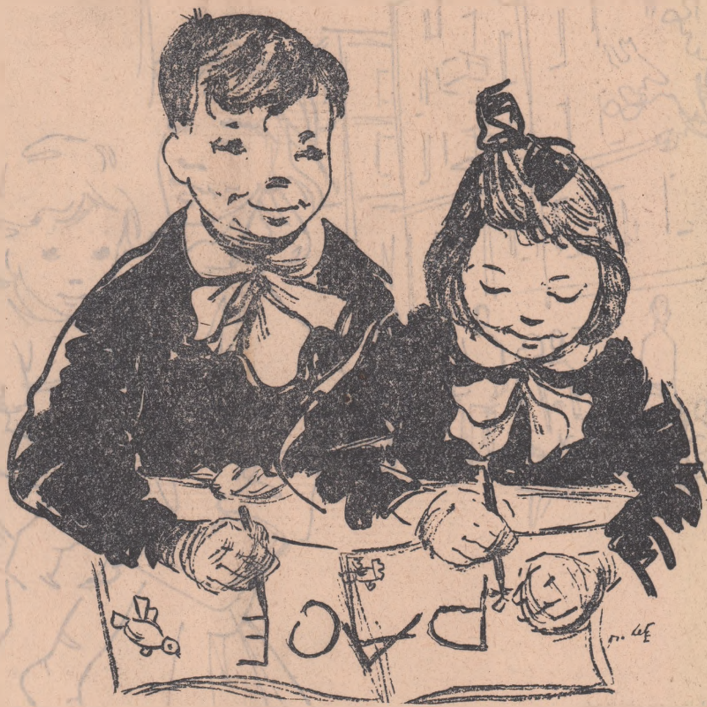
Desen de TIA PELTZ

Manifestări în cinstea Zilei internaționale a copilului