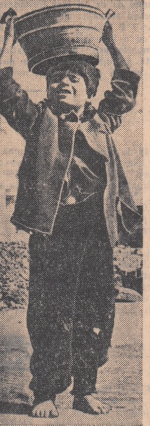
Muncitor — copil din Italia