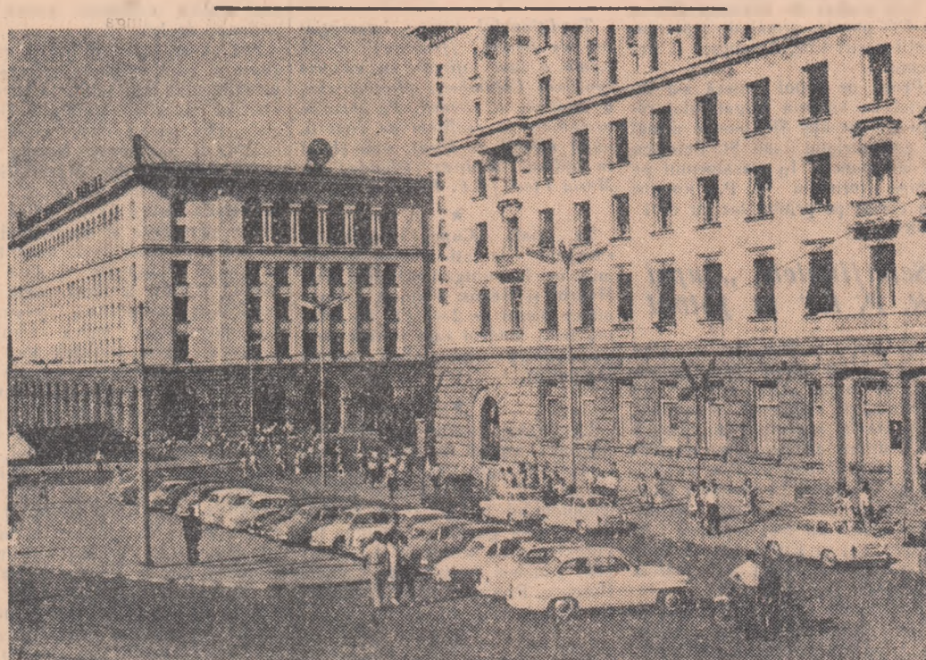
O imagine din capitala Bulgariei — Sofia. În prim plan: hotelul „Balcan”.

Răspunzînd întrebărilor, Eisenhower a declarat totuși că „ar însemna să se dea dovadă de lipsă de realism” dacă s-ar aștepta ca o conferință a miniștrilor de Externe să ducă la încheierea unor acorduri de mare importanță. Cei patru miniștri de Externe, după părerea președintelui S.U.A., au sarcina „de a reduce la minimum divergențele de vederi” dintre Est și Vest și de a pregăti un „document de lucru” care ar urma să fie discutat apoi de șefii guvernelor. Președintele Eisenhower a declarat că un asemenea „document de lucru” ar urma, în concepția sa, să specifice că puterile occidentale „vor continua să-și asume responsabilitățile în Berlinul Occidental”.