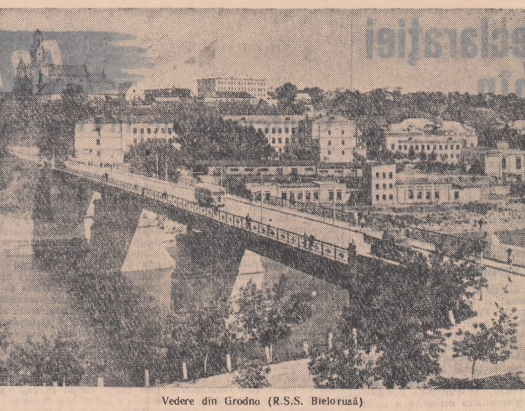
Vedere din Grodno (R.S.S. Beloruse)