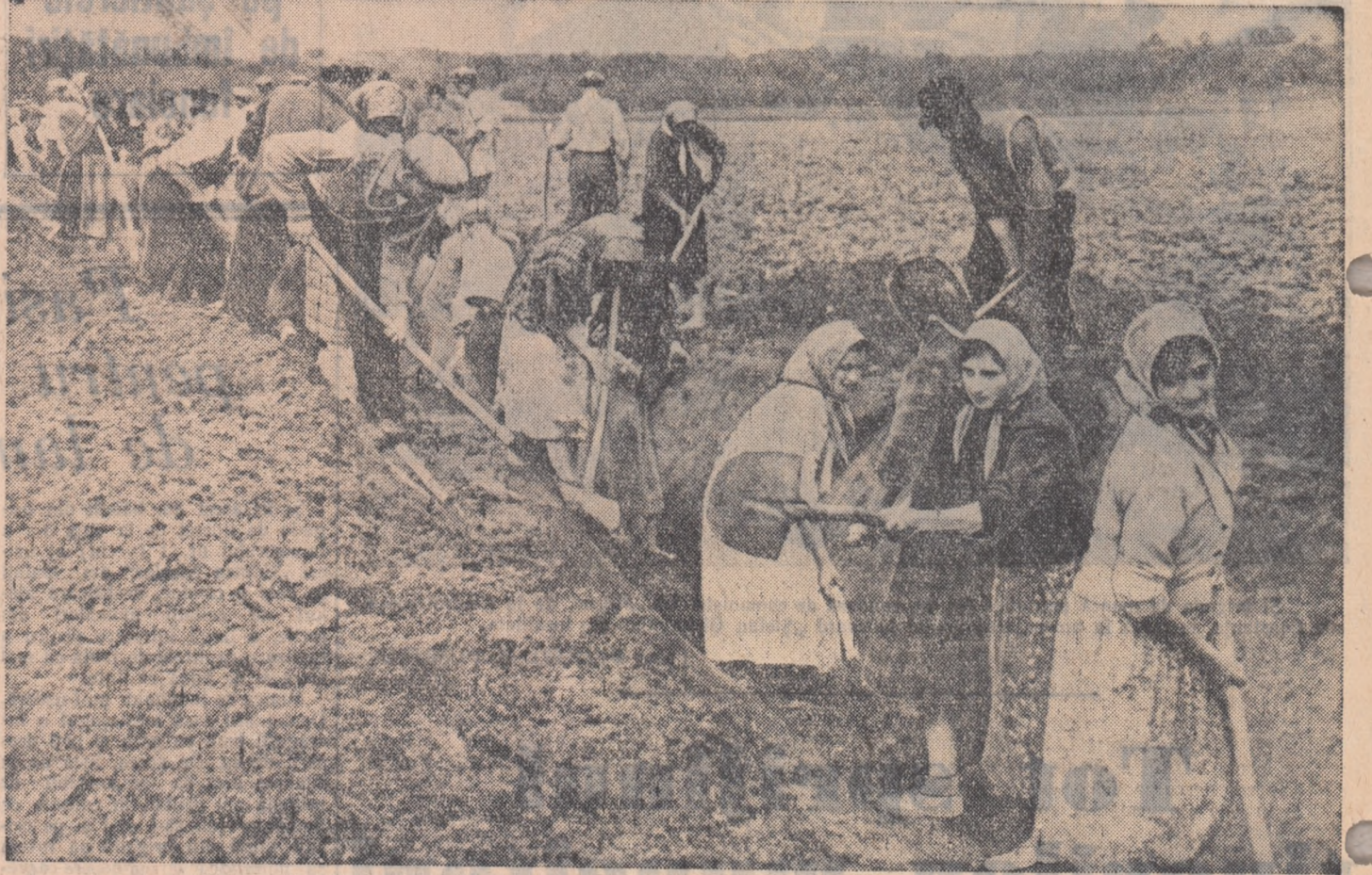
Brigăzile utemiste de muncă patriotică din comuna Brîncoveni, raionul Salonta, în plină acțiune pe șantierul comunal de hidroameliorații.