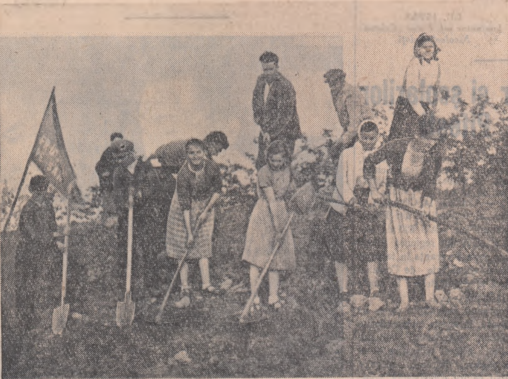
Brigada utemistă de muncă patriotică nr. 1 de la G.A.S. Stoențești lucrează pe șantierul de hidroameliorații pentru irigația de 50.000 de hectare de la Stoențești-Scărișoara, raionul Caracal.