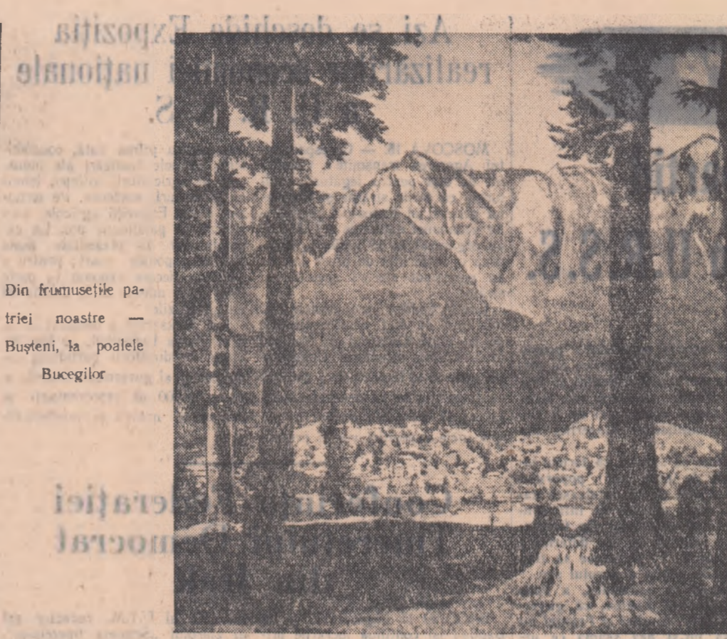
Din frumusețile patriei noastre —

secretar al Comitetului raional U.T.M. Sebes.