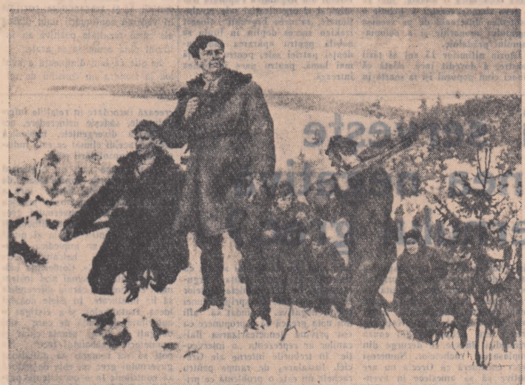
lata tabloul „Pentru patria bielorusă” de V. P. Suhoverhov din expoziție

Caracterul dominant în imaginea picturală și sculpturală și aici eroismul. Personajul principal este partizanul — în compozițiile închinăte Revoluției și Marelui Război de Apărare a Patriei, și marelui război de eliberare care înfățișează realitatea construcției socialiste și comunismului. Partizan și muncitor sint însă două ipostaze ale constructorului societății noi, ale eroului care se dăruiește cu pasiune cauzei comuniste. Acest fapt e insistent subliniat în viziunea plastică a artiștilor bielorusi. Proporțiile monumentale ale compozițiilor sint dictate de o concepție grandioasă despre om, sint create pe măsura științifică a revoluționarului. Figura acestuia e unică în nenumărate înfățișări particulare; o figură severă dar fără duritate, exprimînd o conștiință concen-