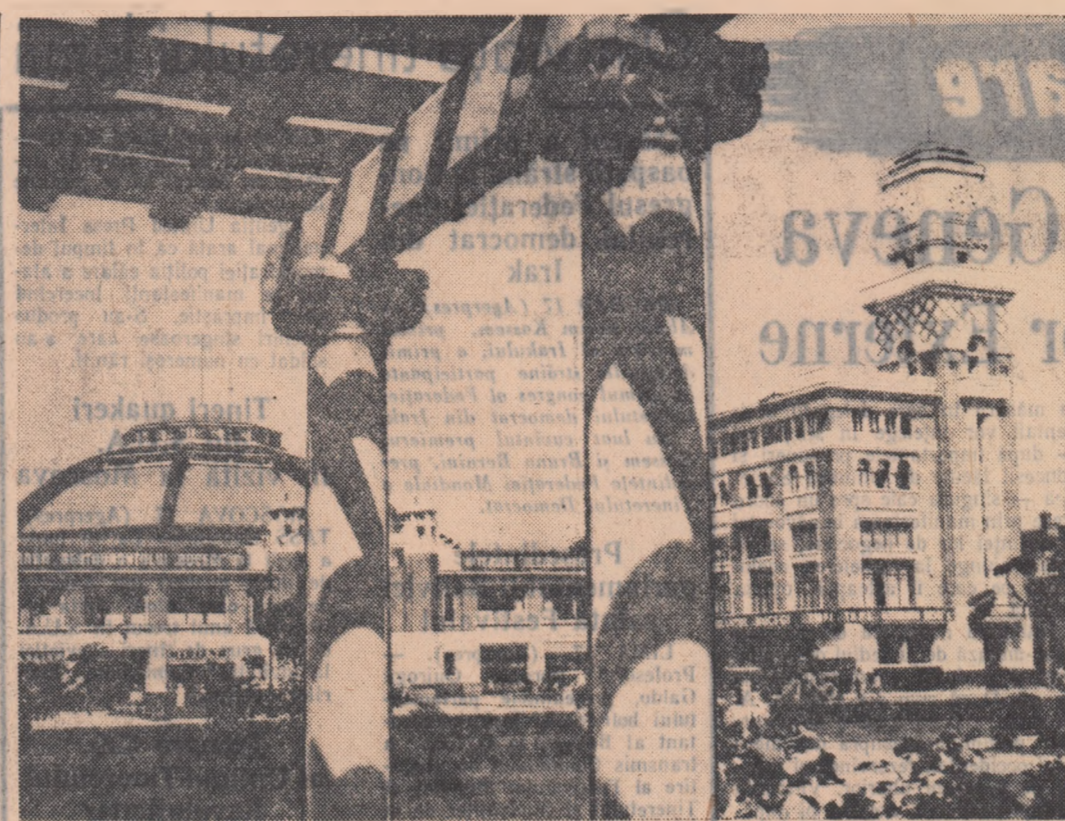
Vedere din Ploiești