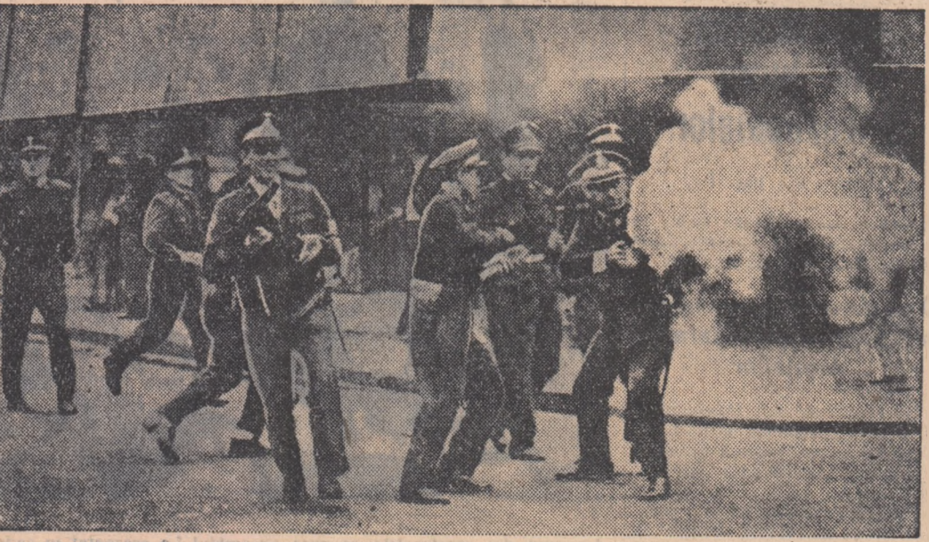
Politia din Buenos Aires a intervenit cu gaze lacrimogene și arme împotriva funcționarilor de bancă aflați în grevă pentru condiții mai bune de trai.

posede resurse de petrol, sînt slab dezvoltate din punct de vedere economic. Un amplu articol despre progresul industriei petrolifere din R. P. Romină a fost publicat în ziarul indonezian „Ilarian Pemuda”.