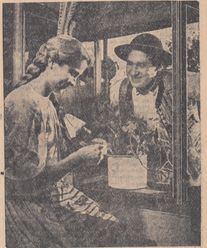
— Să știi! Dumnică la horă joci numai cu mine!