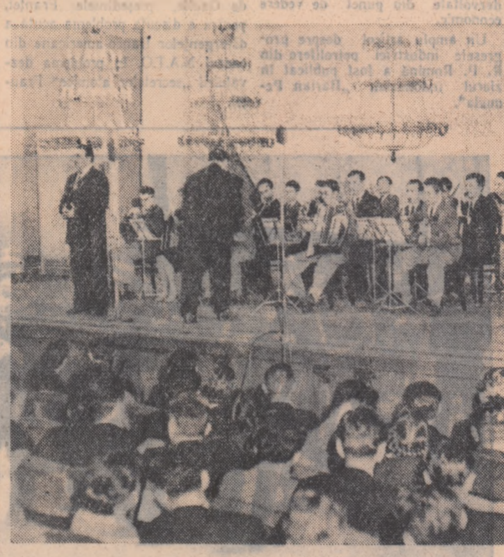
La unul din spectacolele pe care ansamblul l-a prezentat în cadrul trecerii în revistă a formațiilor de amatori pe scena din Sala Coloanelor a Casei Sindicatelor din Moscova

Cîntărețul mexican — Patria, Grădina Dinamo (Cal, Floresca 20—22) — București, Grădina 13 Septembrie, Vasile Roașă, Volga; Cîntecul matorozilor — Republica, Libertății; Umbrela șinului Petru — Magheru, I. C. Frimu; Întîlnirea între popoare , N. Bălescu; Alarma la ganișă — Alexandru Lumina, Gh. Doja; Fata din Kiev (seria 1-a) — Central, Miorita; Doi vecini — Prima me odie — 13 Septembrie, T. Vladimirescu, 23 August; Moscova și matorozii — Maxim Gorki; Bătăria lui Anatol — Victoria; Program de filme documentare și de desene animate — Timpuri Noi, Alex. Popov; La ordinea dă: Tineretului: Fata din Kiev (seria 1-a) — 8 Martie, I. Mai, Alex. Sahia; Meiba — Grivita, G. Bacoș; Taijuri la Nagasaki — Cultural, Ile Pintile; Tatăl meu actor — 8 Mai; Întîlnire la bar — Unirea; Chemarea văduhului — C. David; Trapez — Flacăra; Oleko Dundici — Arta, 30 Decembrie; Ivan cel Groaznic — (seria 1-a) — Munca; Favoritul 13 — Danca Simo, 16 Februarie; Burghieșii gentililor — Popular; Între noi parinții — M. Eminescu; Arvizorul 420 — G. Coșbu.