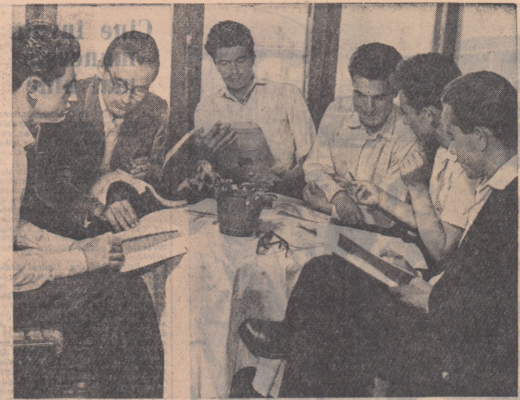
O ultimă repetare a materiei înainte de examen. În fotografie, studenții grupei 1341 din anul IV al Facultății de Zootehnie din București, se pregătesc pentru examenul de patologie.

Grupa a VI-a pediatrie din acest an a depus în tot timpul anului școlar, o muncă de bună calitate; pregătirea minuțioasă a cursurii și lucrării, preocuparea pentru pregătirea din timp a sesiunii de examene a dat rezultate. La primul examen — de medicină judiciară — toți studenții grupei au obținut nota 10. Și la următoarele 2 examene studenții grupei s-au comportat excelent: un singur 7, un singur 8, în rest 9 și 10.