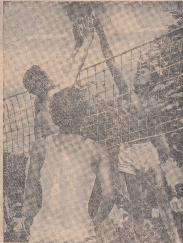
Voleul este una dintre cele mai antrenante discipline sportive din cadrul Spartachiadei de vară a tineretului. Iată o imagine surprinsă de obiectivul fotografic de la întrecerile etapei a II-a la care au participat sportivii din satele raionului Domnești.