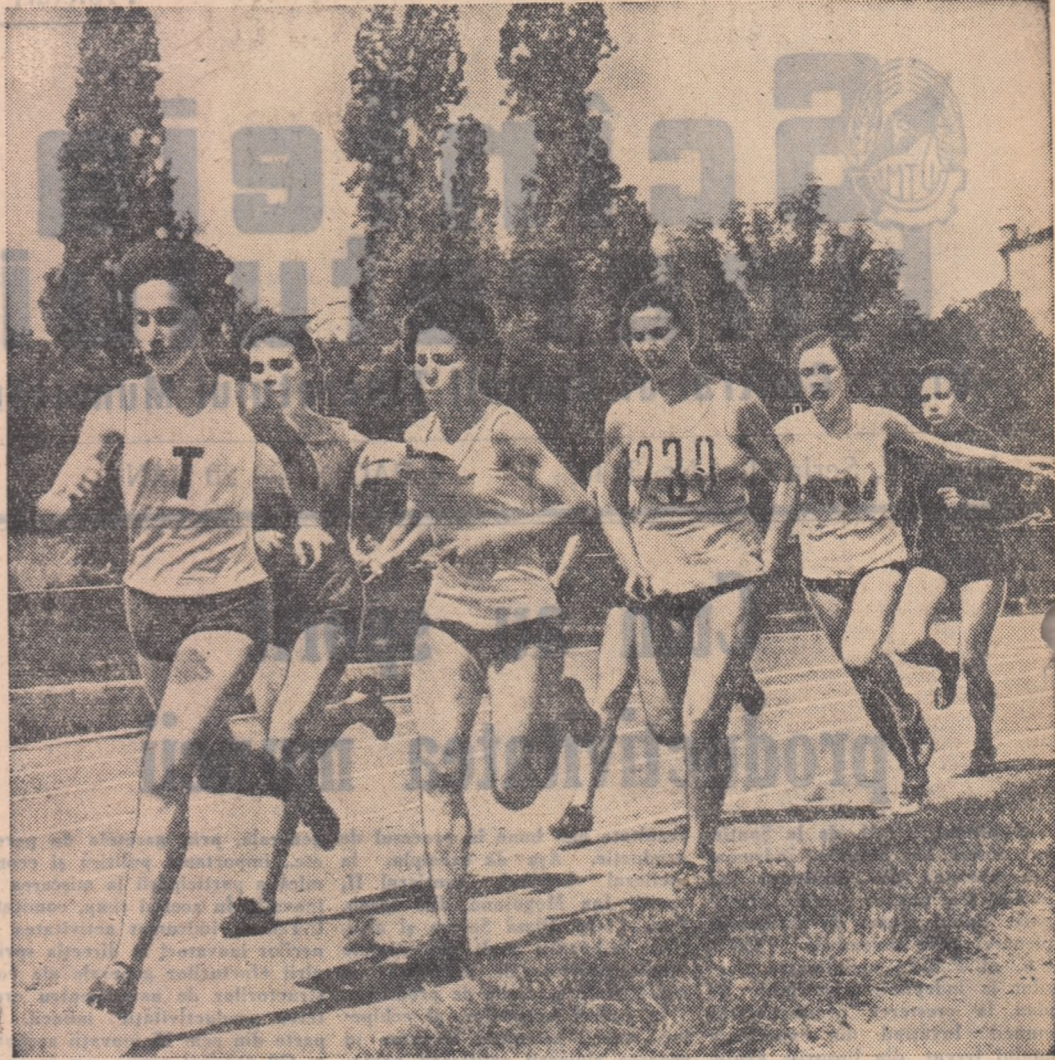
A X-a ediție a campionatelor școlare de atletism