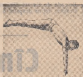
Gu ocazia concursurilor de inot deslășurate duminică la Strandul Tineretului, au evoluat și cîțiva fruntași ai săriturilor de pe trambulină. Unul dintre aceștia execută o săritură din turnul de 10 metri.