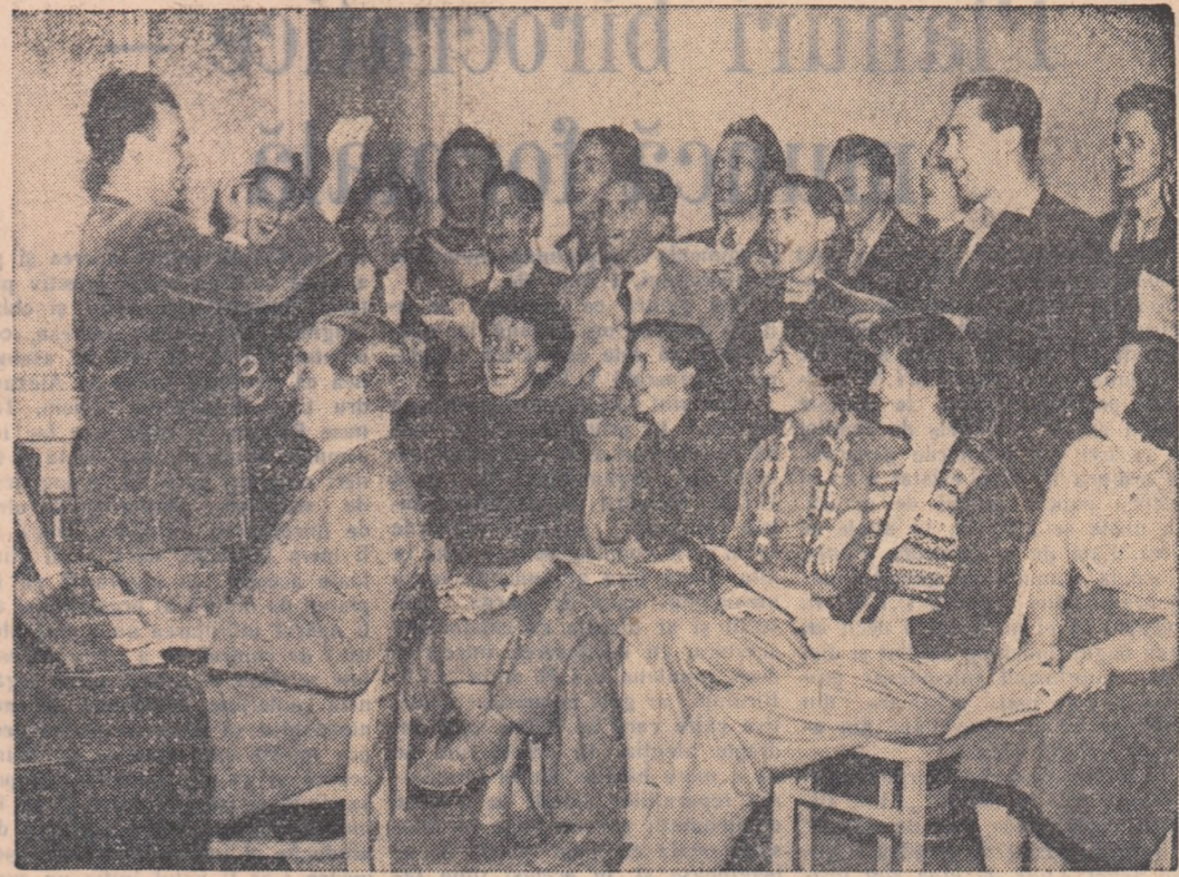
O imagine din R. Cehoslovacă. La clubul întreprinderilor „Jan Sverma“ din Brno, corul tinerilor muncitori în timpul unei repetiții.

MOSCOVA. — Președintele Sovietului Suprem al U.R.S.S. a transformat Ministerul Unional-Republican al Încălzimentului Superior al U.R.S.S. în Ministerul Unional-Republican al Încălzimentului Super-