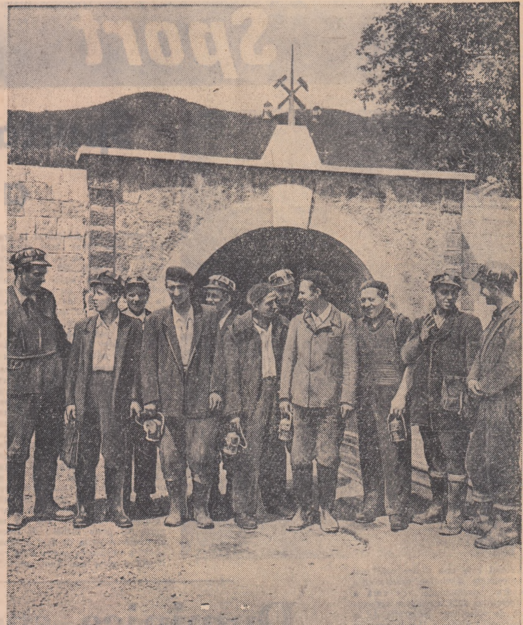
Iată un grup de mîneri de la întreprinderea minieră „Petre Gheorghiu” din regiunea Baia Mare, la ieșirea din galeria Săsar.

Duminică, la Mangalia s-au dat în folosință primele construcții ridicate aici în etapa I-a de lucrări prevăzute în planul de sistematizare și modernizare a orașului. Astfel, s-a terminat și dat în folosință un centru de odihnă pentru oamenii muncii, compus din 5 corpuri de clădiri cu 1.066 paturi și primul lot de locuințe muncitorești însumînd 104 apartamente. A fost terminată de asemenea construcția unui bloc alimentar cu o cantină-restaurant modernă, cu fabrică de gheață, fabrică de sifoane, laborator de cofetărie etc., precum și 17 magazine alimentare pentru deservirea orașului. Totodată s-au terminat și lucrările principale de alimentare cu apă și energie electrică, lucrările de canalizare, cele de amenajare a falezii, a plajei și spațiilor verzi din jurul noilor construcții.