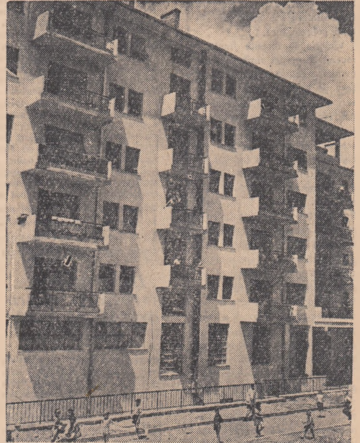
În orașul Cluj vor fi date în folosință în acest an 700 de apartamente. Pînă acum au fost terminate peste 100 de apartamente, iar în prezent se lucrează la construcția a 17 noi blocuri. Prețul de cost al unui apartament compus din 2 camere și dependințe este de 30.000-40.000 lei. În fotografie: vedere a blocului din str. Horea 90-104 dat în folosință la începutul acestui an.