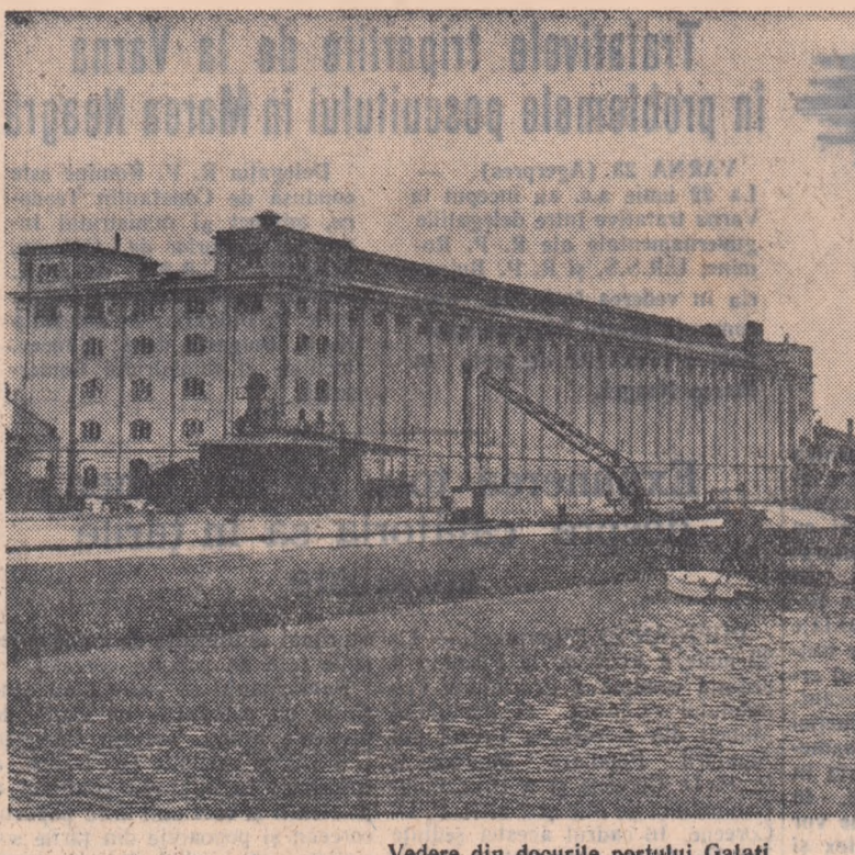
Vedere din docurile portului Galați