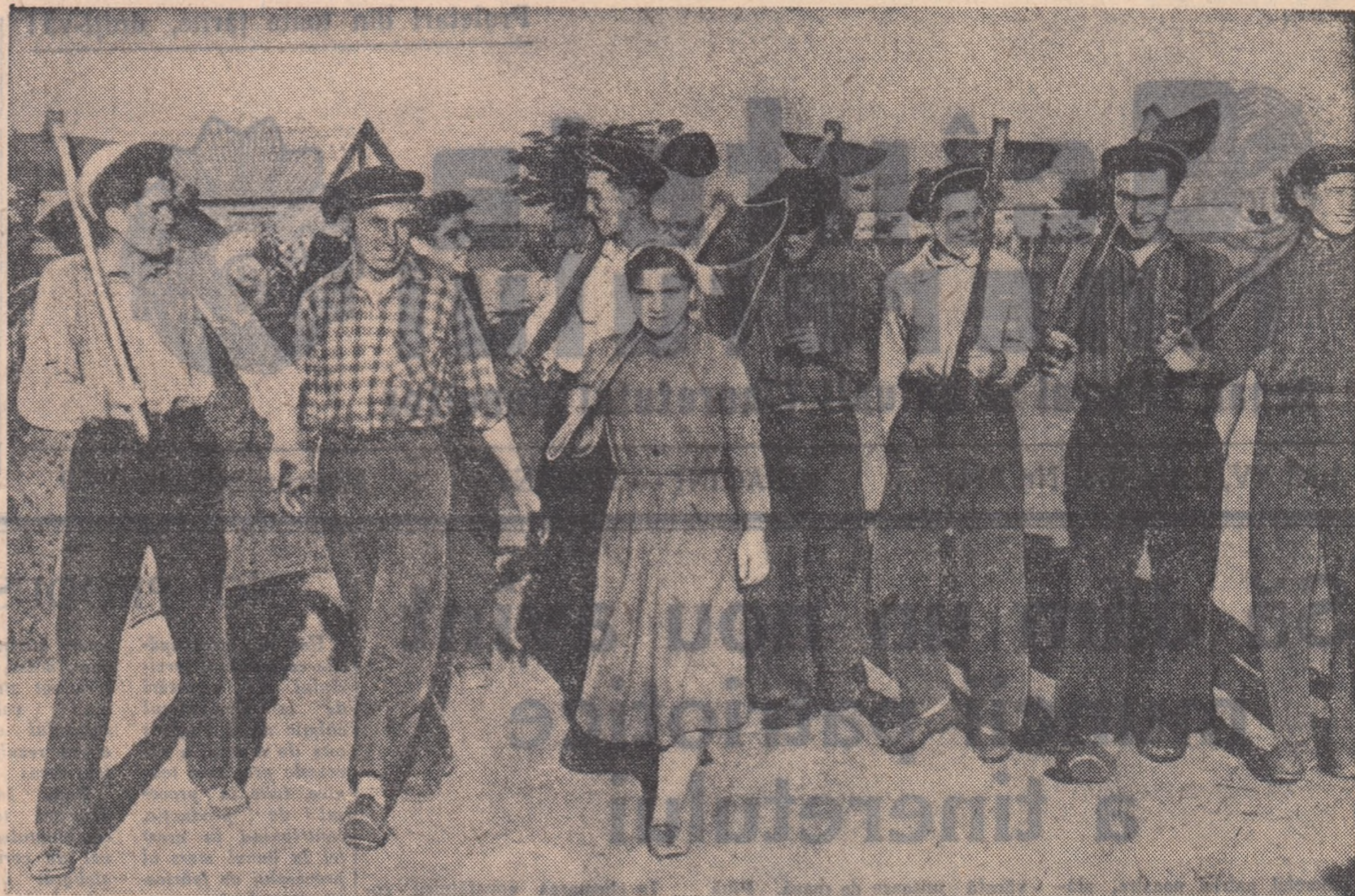
Încă din zorii zilei, de la plecarea în cîmp, începe voia bună și hotărîrea de muncă a tinerilor colectivști din Radu Vodă, raionul Lehliu. În tot restul zilei atmosfera aceasta îi va îndemna la o muncă stăruitoare și rodnică.

V. APARASCHIVEI correspondentul „Științei tineretului” pentru regiunea Galați