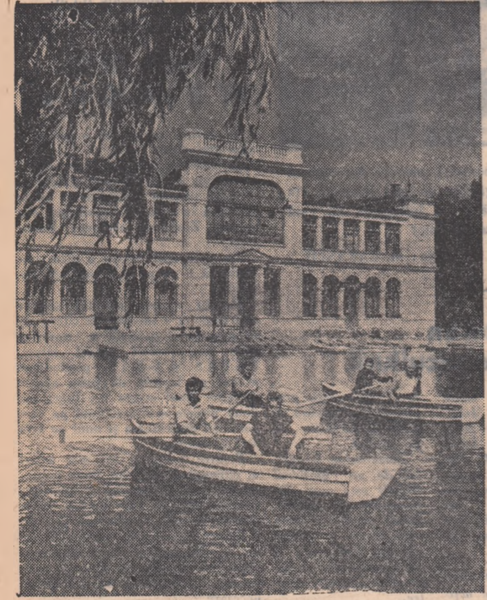
Vedere din parcul orașului Cluj