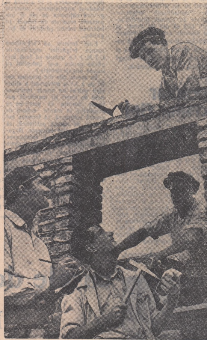
Brigada artistică de agitație a gospodăriei colective din comuna Corbeana, regiunea București pregătește un nou program. În vederea documentării, membrii brigăzii au întreprins un raid la locul de muncă al tinerilor