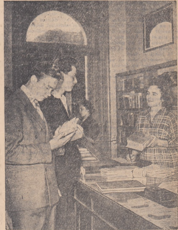
Biblioteca regională din Oradea, care are peste 80.000 de volume, primește zilnic circa 500 de cititori. Aici vin tinerii muncitori, elevi, funcționari de toate vrstele pentru a găsi cărțile care îi interesează.