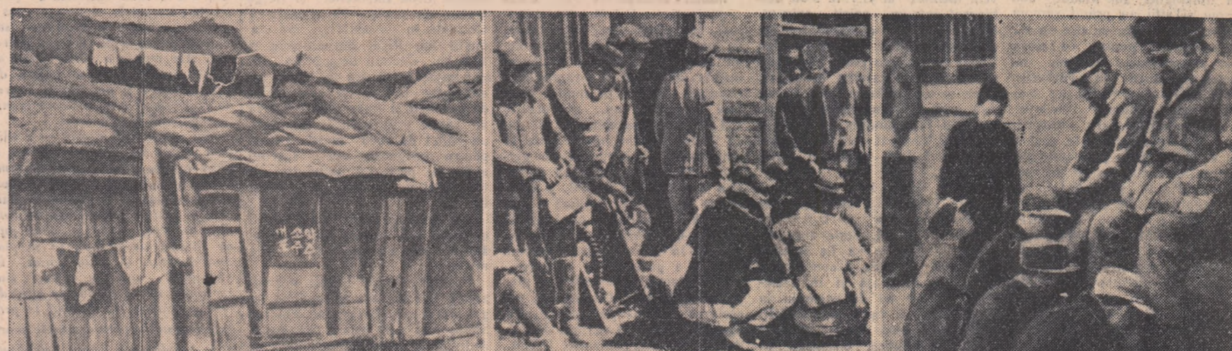
Iată în ce situație dezastruoasă a ajuns Coreea de sud. Imaginile noastre vă înfățișează: barăcile memorice în care în neagră mizerie locuiesc nenumărați sud-coreeni (sînga); muncitorii sud-coreeni în grevă pentru satisfacerea revendicărilor lor (mijloc); copii sud-coreeni sînt nevoiți să curățeze cizmele militarilor americani spre a avea din ce trăi (dreapta).

În declarația lor, emigranții politici își exprimă aprecierea față de popoarele și guvernele care le-au acordat ospitalitate. Conferința a subliniat în același timp că emigranții politici greci sînt pătrunși de dorința de a se reînțoarce în patrie cît mai repede posibil pentru a-și putea conșansa acolo forțele cauzăi păcii și redresării democratice. Ei adresează din nou un apel partidelor politice, tuturor organizațiilor patriotice și progresiste și întregului popor grec cerîndu-le să sporească eforturile în vederea repatrierii emigranților politici pentru ca să se pună în cele din urmă capăt dușmăniei care nu poate să slujească decît inamicilor Greciei.