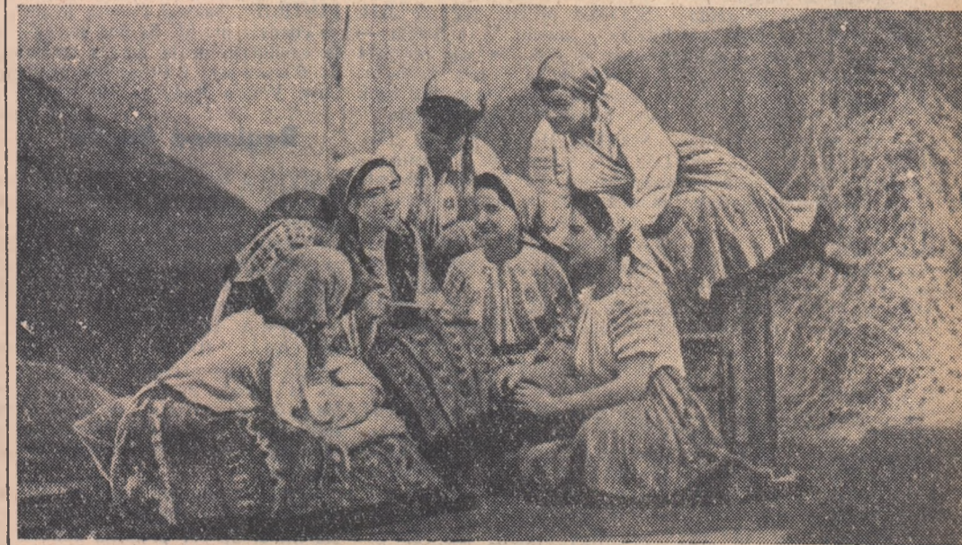
Moment dintr-un spectacol prezentat de echipa artistică a căminului cultural din Răcăciuni, regiunea Bacău.

care au terminat din vreme recoltatul orzului. În aceste zile organizațiile de basă U.T.M. din celelalte C.A.C.-uri din raion desfășoară o pasionantă întrecere pentru terminarea secerișului orzului și se pregătesc ca peste cîteva zile să înceapă secerișul grîului. B. CORNEANU