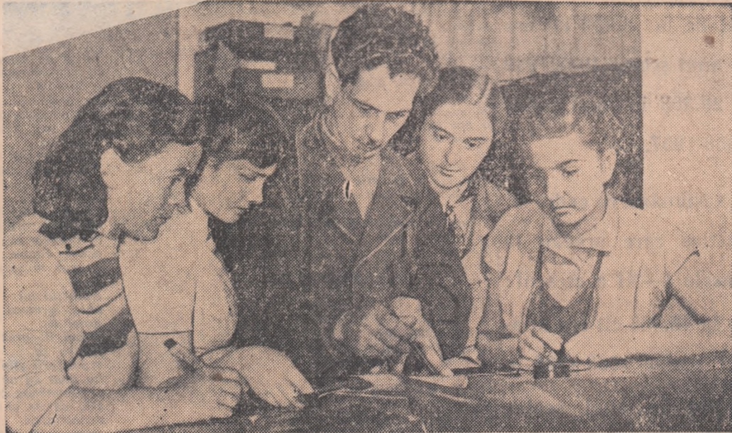
Eleve de la școala profesională a fabricii de încălțăminte din Oradea la practică.