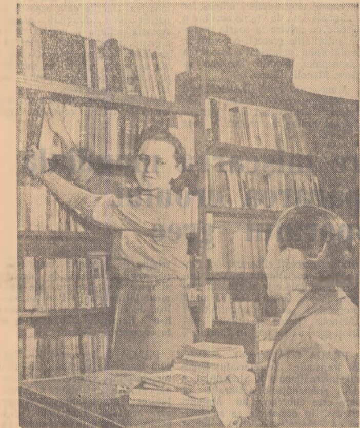
La biblioteca comunală din comuna Cristianu, regiunea Stalin se desăvârșea o vie activitate culturală. Tinerii din comună vin aici zilnic pentru a împrumuta cărți.