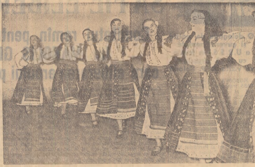
Formația de dansuri a întreprinderii „Kirov” din Capitală executând un frumos joc popular.