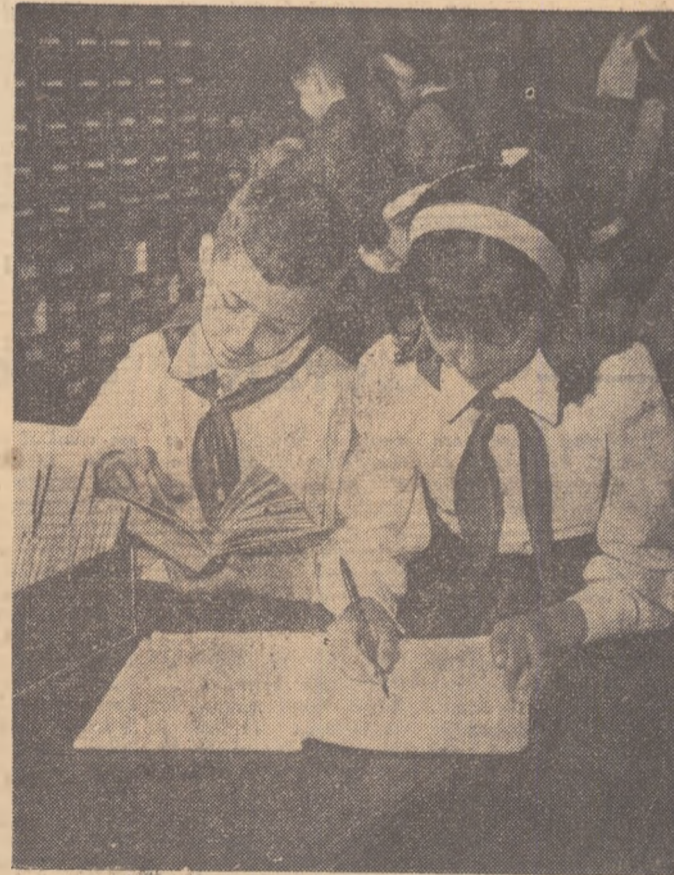
În vacanță, la bibliotecă