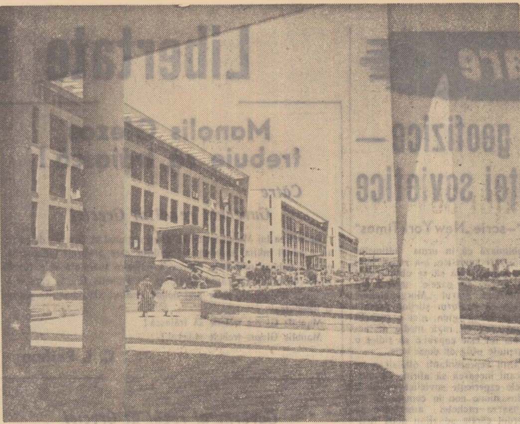
O imagine din Eforie