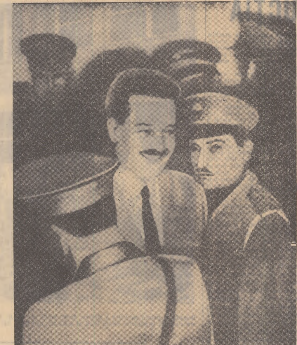
Manolis Glezos escortat de polițiști

Seara, președintele societății „Bel and Howell Company”, Percy, a oferit un dîneiu în cinstea lui Frol Kozlov la care a participat Stratton, guvernatorul statului Illinois precum și reprezentanți ai opiniei publice și ai cercurilor de afaceri din acest stat. Dîneiu s-a desfășurat într-o atmosferă prietenească.