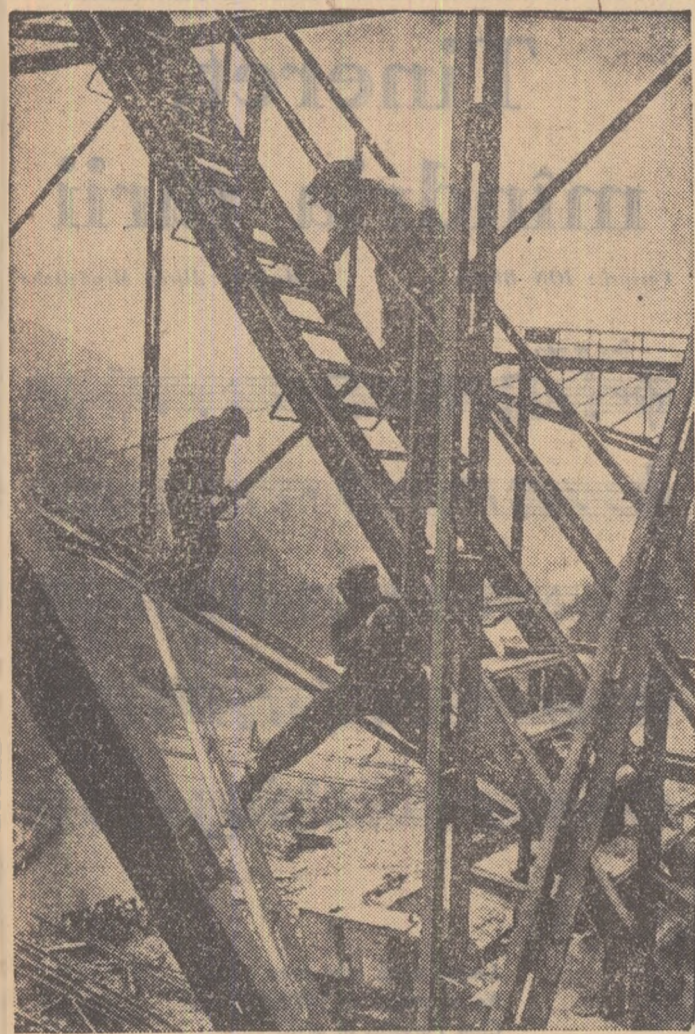
„Construim” de IOSIP GIUCA (Din expoziția de fotografii artistice a tineretului)