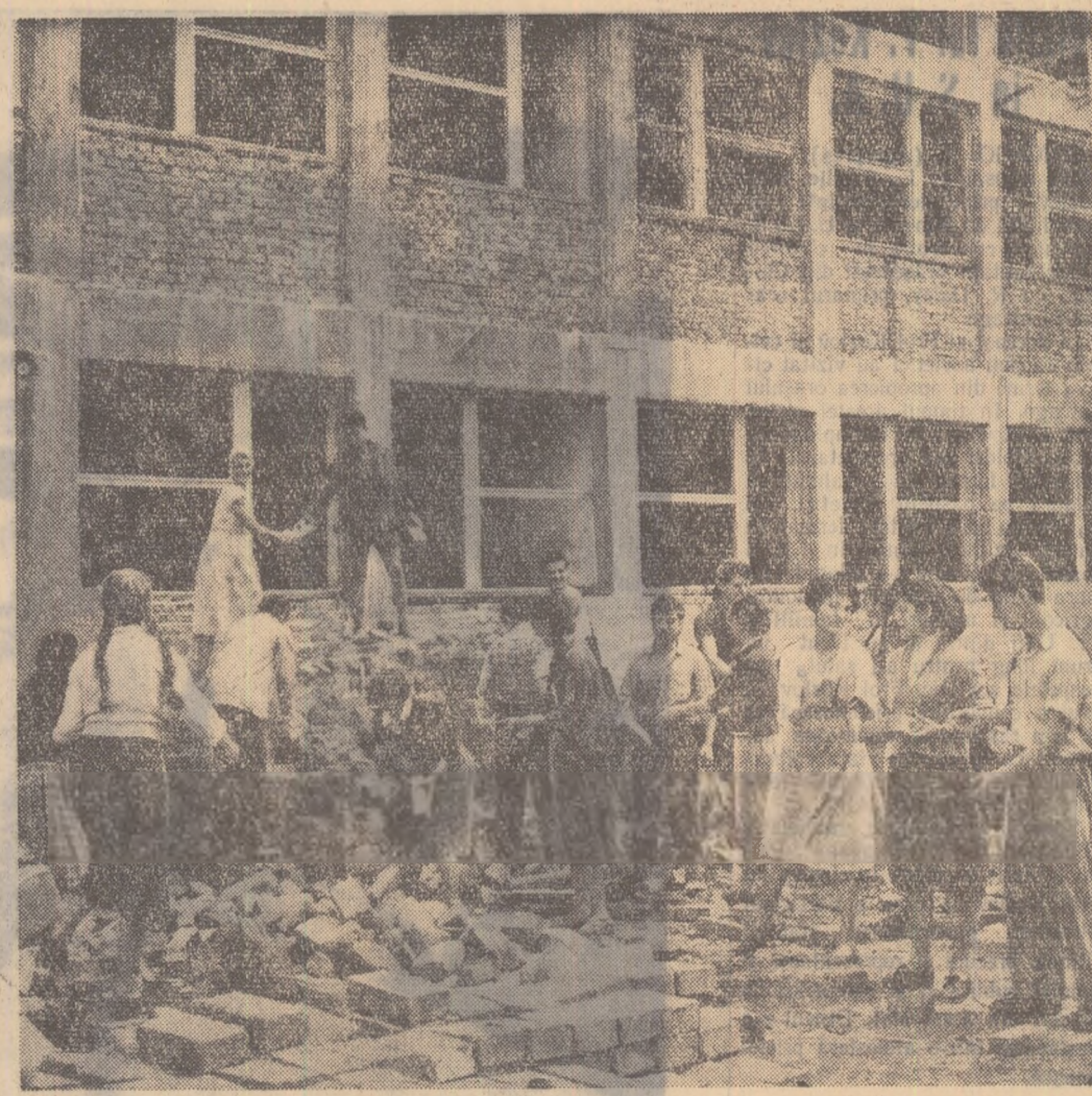
Brigada de muncă patriotică a elevilor Școlii medii nr. 34 „G. A. Rosetti” din Capitală lucrează cu entuziasm la construcția noului local al școlii lor, care va fi dat în folosință în toamna acestui an.