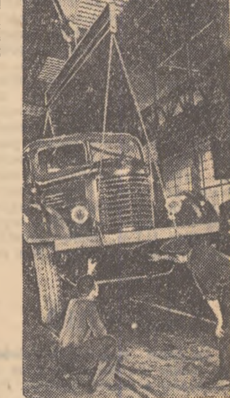
La uzinele de autocamioane „Steagul Roșu” din Orașul Stalin, se face un strict control unul nou autocamion.

Însemnate realizări au înregistrat cele 543 brigăzi de producție ale tineretului din întreprinderile industriale și cooperativede meșteșugărești, care cuprind aproape 7.000 de tineri. Echipele de laminorii de la Uzinele „Industria Sirmii” din Cimpia Turzii, de pildă, au dat în ultima lună cu 8 la sută mai multe laminate decît prevedea planul.