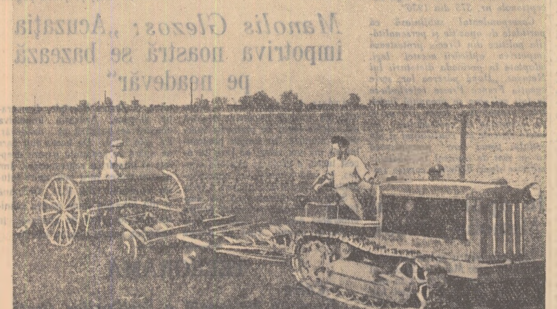
Paralel cu lucrările de recoltare a culturilor de pătoase, la G.A.S. Roșia, regiunea București, se face și însămînțatul suprafețelor ce au fost recoltate ca masă verde.