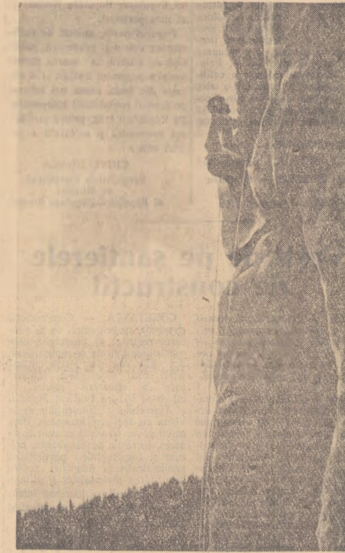
Curajul, voința vor învinge și de astă dată în lupta cu stîncă abruptă a muntelui