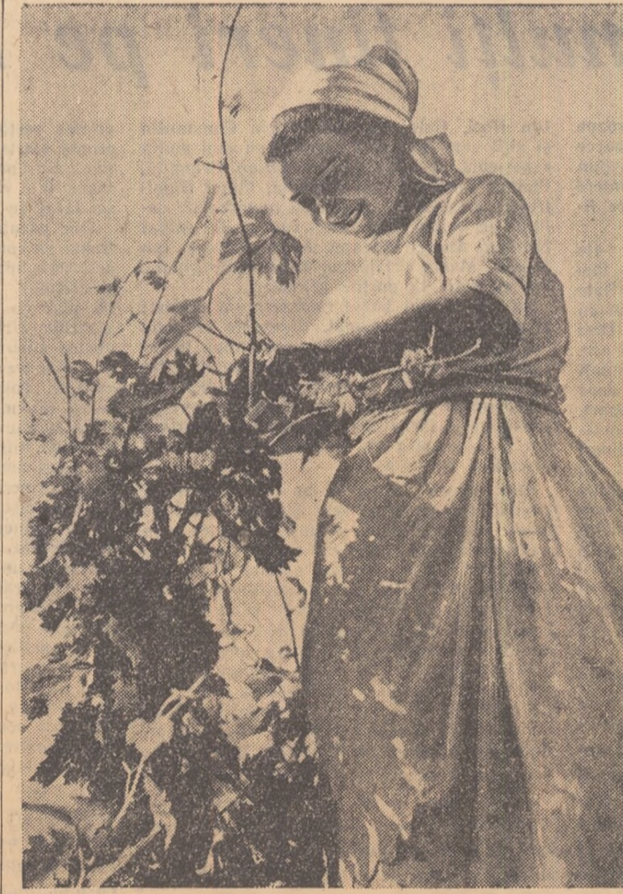
„În via” de ELENA ZLOTEA Din expoziția de fotografii artistice a tineretului