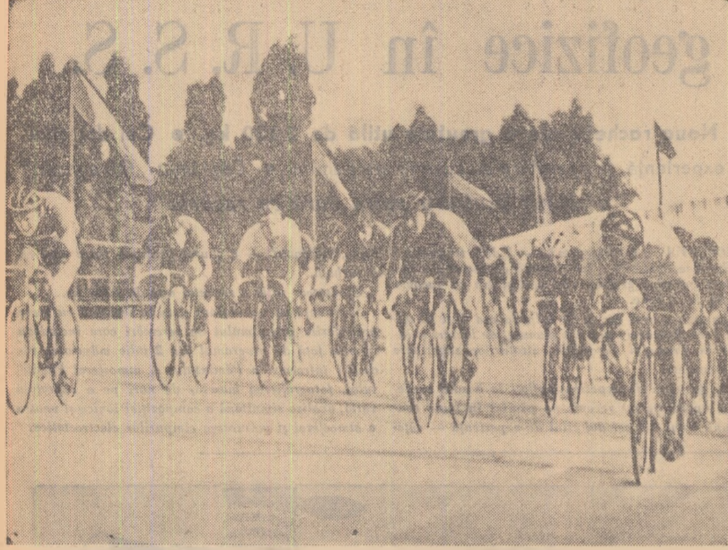
Velodromul Dinamo a găzduit duminică întrecerile campionatului de semifond pe pistă. Vă prezentăm o imagine de la întrecerea seniorilor.