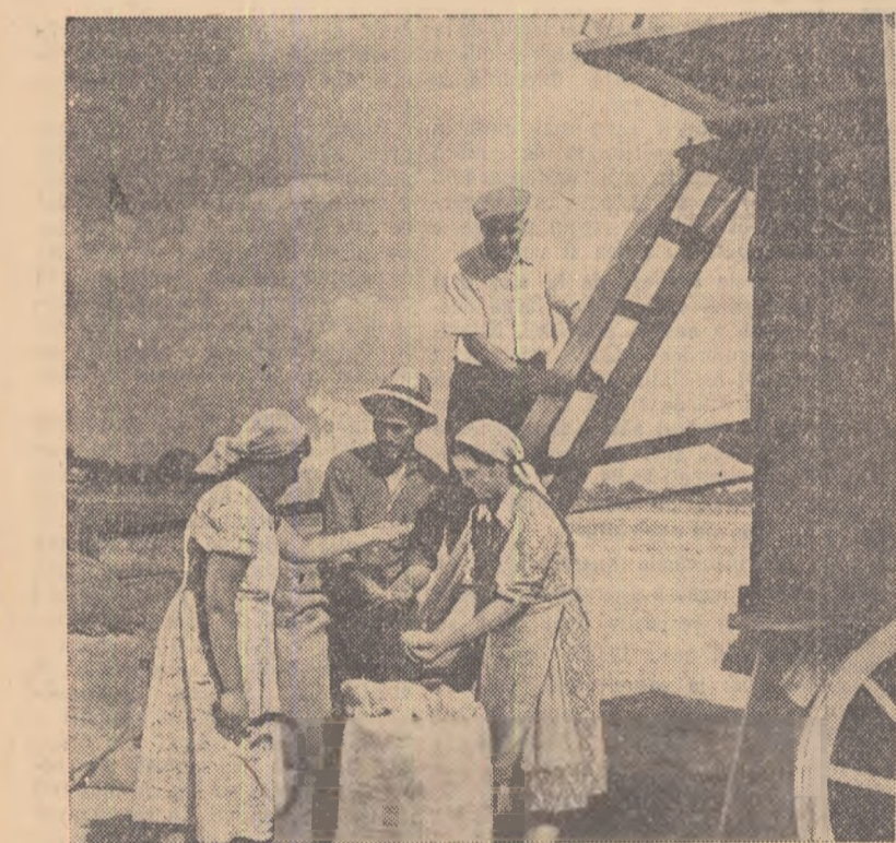
Recolta acestui an a fost bogată. Antevârșii din Otopeni, regiunea București care au lucrat pămîntul cu sprîinul S.M.T. și au aplicat întocmai regulile agrotehnice la culturile de grâu, au obținut un spor de recoltă de aproape 200 kg. la hectar față de anul trecut.

Pentru a putea descoperi noi resurse interne, pentru a mări continuu productivitatea muncii, e necesar ca tinerii petroliști să