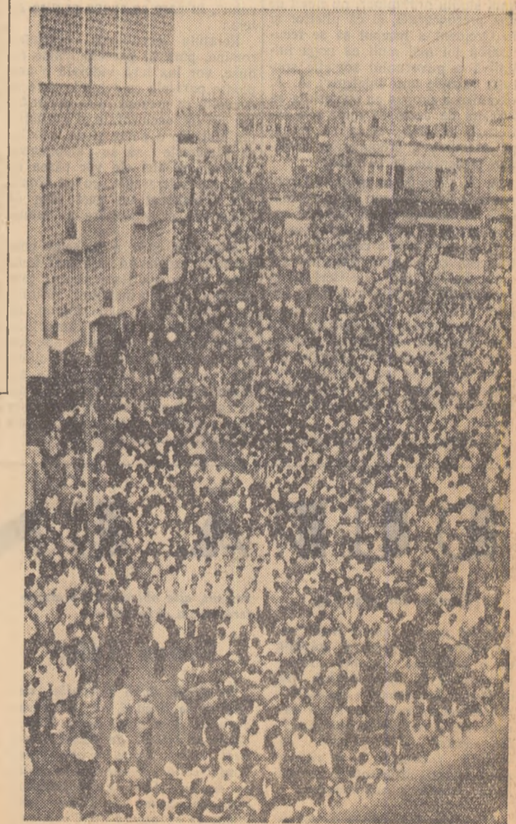
Pe Al Rașid o parte din cei 400.000