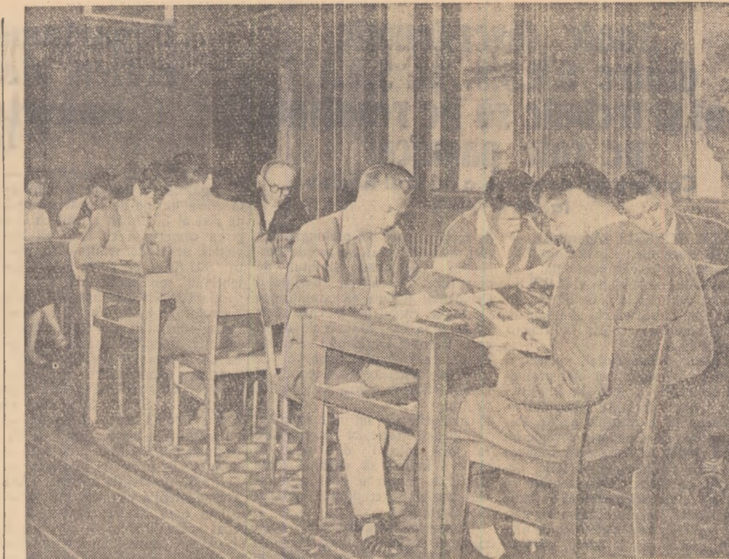
Biblioteca regională din Oradea numără peste 80.000 de volume. Aci vin zilnic numeroși tineri