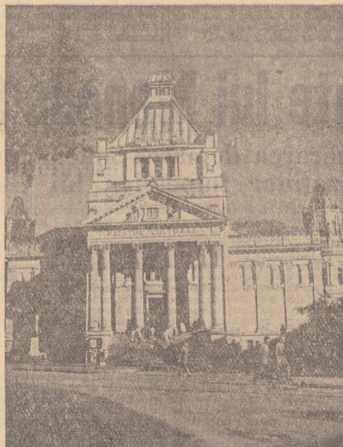
Palatul cultural din Arad

Educația elevilor prin muncă a constituit de asemenea una din preocupările importante ale cadrelor didactice. Anul acesta, ca de altfel și în anul trecut, înainte de încheierea cursurilor elevii au muncit un anumit timp în fabrică, în atelierul școlii, în cadrul G.A.S.-urilor și G.A.C.-urilor. Aici elevii au avut posibilitatea să aplice cunoștințele teoretice acumulate în școala în activitatea practică, în producția. Aceasta, a contribuit la dezvoltarea la elevi a dragostei pentru munca fizică, a dorinței de a se îndrepta spre meseriile productive. În constatarea, cadrele didactice au vorbit despre faptul că organizațiile U.T.M., de pionieri din școlile raionului Curtea de Argeș au contribuit la realizarea acestei sarcini mobilizîndu-i pe elevi să desășoare o muncă susținută în perioada activităților practice. Ca urmare a eforturilor școlii de a lega tot mai mult învățămîntul de viață, nu puține au fost cazurile cînd o seamă de elevi și-au manifestat dorința ca după terminarea școlii să lucreze în producție, să se califice și apoi să meargă pe calea specializării superioare. S-a apreciat că munca în producție, desfășurată alături de muncitorii a contribuit la întărirea disciplinei în rîndul elevilor, la maturizarea, delimitîndu-i să muncă mai bine pentru a răspîndi astfel munca harnicilor noștri producători de bunuri materiale care le asigură și lor, elevilor, un trai