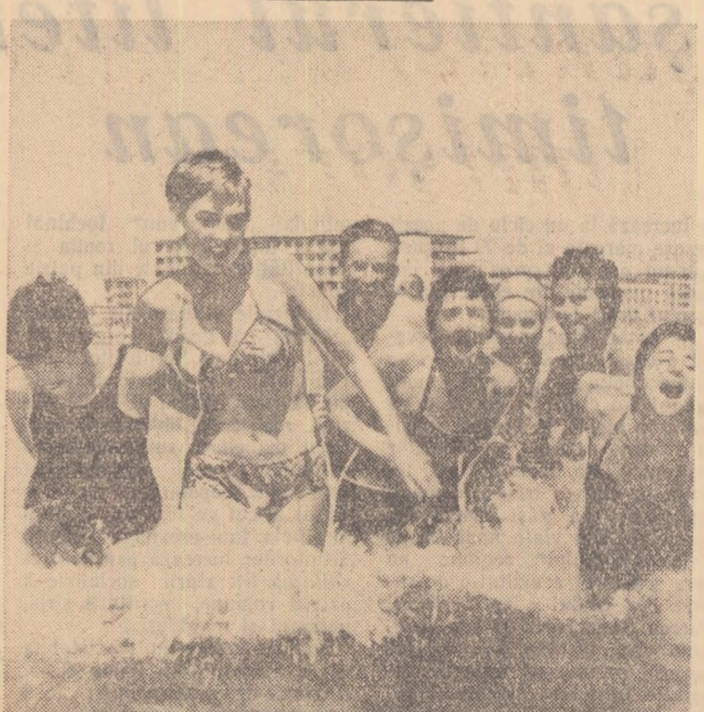
Sportivele secției de natație de la clubul „Știința București” împreună cu antrenorul lor se bucură de o vacanță plăcută la mare