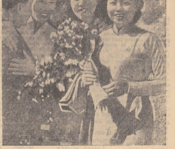
Spre Viena — orașul Festivalului. Delegația tineretului vietnamez, în trecere prin Uniunea Sovietică este întâmpinată de către tineri sovietici cu o deosebită căldură.

educația fizică a elevilor și studenților din R. P. Romine; delegația Canadei s-a arătat interesată de organizarea învățămîntului tehnico profesional în țara noastră, delegația Filipinelor a subliniat necesitatea de a se organiza cursurile de învățămînt profesional etc. În aceeași zi delegația romină a prezentat conferinței standul rezervat țărilor noastre în cadrul expoziției țărilor participante la conferință. Standul R. P. Romine a fost vizitat de numeroase delegații care și-au exprimat interesul și satisfacția pentru datele interesante și expozitele prezentate.