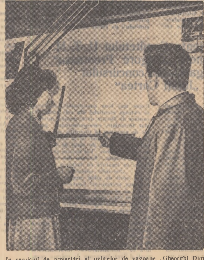
În serviciul de proiectări al uzinelor de vagoane „Gheorghe Dimitrov” din Arad.