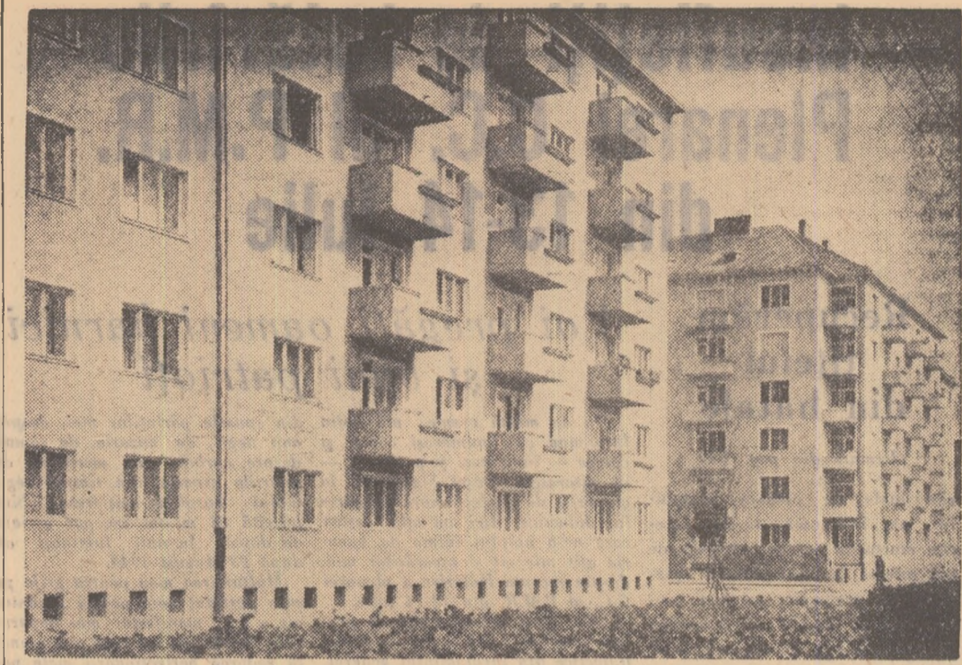
În Cehoslovacia democrat-populară se acordă o grijă deosebită construcției de locuințe, pentru oamenii muncii. În fotografie: noile blocuri din unul din cartierele orașului Kosice

Simbătă A. A. Gromiko a oferit un dejun lui Christian Herter. Luni va avea loc la reședința lui Selwyn Lloyd un nou dejun de „lucru” al miniștrilor de externe ai celor patru puteri, iar pentru marți după-amiază este programată o sesiune plenară la Palatul Națiunilor.