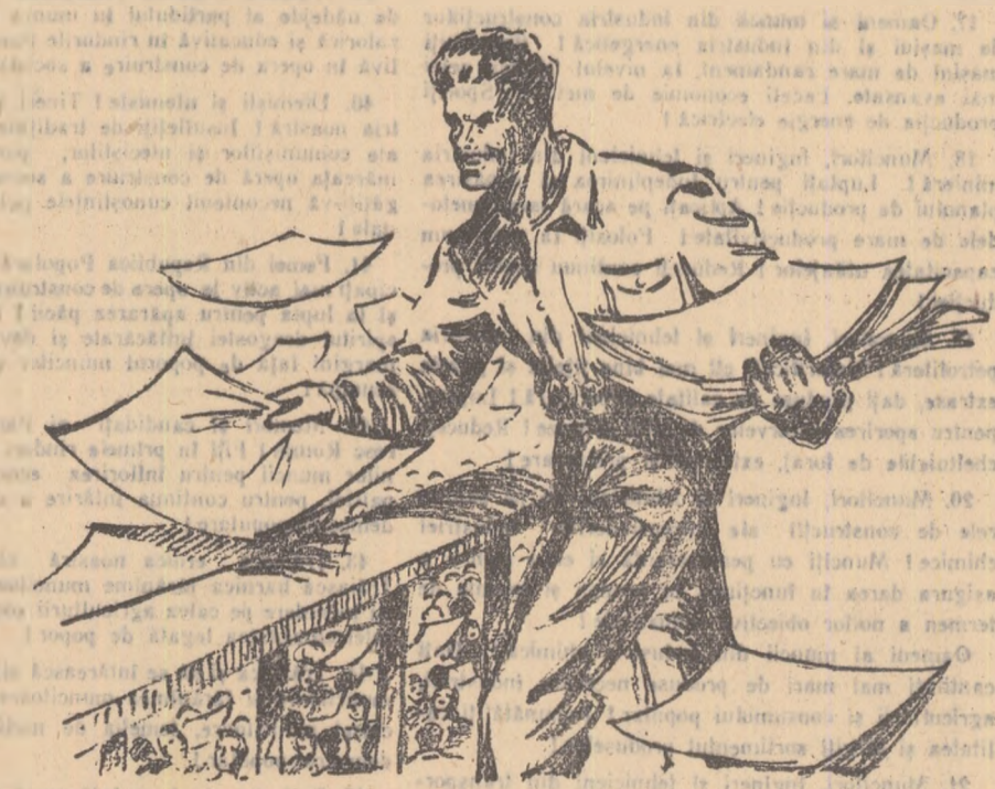
Desene de A. CALISTRAT

Horia: (care-l ascultăse pe Andrei vede și el de abia acum) Ion (duce învînturat mîna la cap să scoala o pălărie care nu există) Ion... Unul dintre cei mai bunii... Și toamai acum... acum cînd am învîntat... Doru: (întră) Ați auzit? Am învîntat... Neculai, unde-i Neculai... se legîtează... (Îl vede pe Ion, se repede într-avolo) Ioane, Ce-i cu tine? (se întoarce disperat spre ceilalți) - lăsa mîinile în jos, înce!