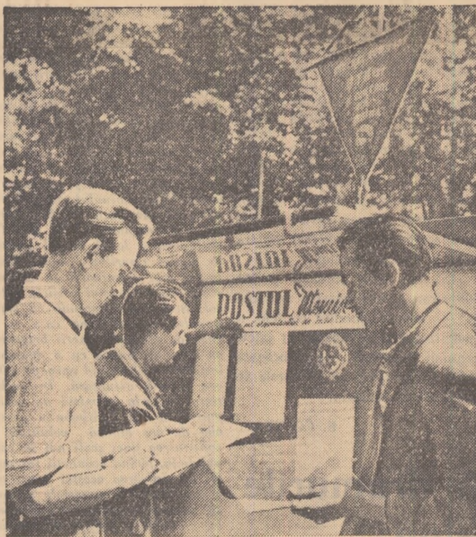
Membrii postului utemist de control, de la fabrica de amoniac a Combinatului chimic „I. V. Stalin” din orașul Victoria schimbă articolele gazetei.